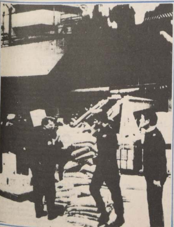
PORTSMOUTH, Inglaterra. — Efectivos británicos cargan vehículos, comestibles y suministros de guerra a bordo del portaviones "Hermes", el segundo de la Armada de Gran Bretaña. Esta poderosa unidad naval zarpará hoy rumbo a las Islas Malvinas, conjuntamente con el portaviones "Invencible", y más de treinta naves de combate.