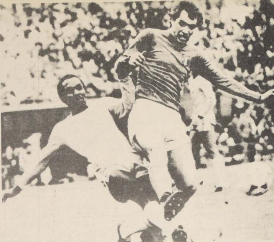
Roberto Bettega es una de las cartas que más preocupa al DT itálico. Ya está entrenando, pero nada se sabe de su actual estado. ¿Se recuperó de su grave lesión?