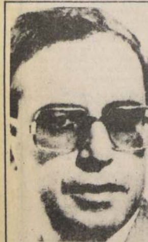
PARIS. — Foto reciente de archivo de Yacov Barsimantov, diplomático israelí asesinado en la capital francesa.

En días previos a una devaluación de la moneda de un 76 por ciento dictada por el gobierno, el Banco Central vendió gran cantidad de dólares a particulares.