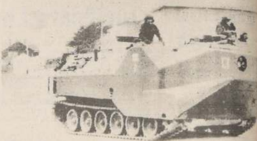
PUERTO RIVERO. — Islas Malvinas. Tanques argentinos en las calles de Puerto Rívero (Port Stanley) después de que las fuerzas trasandinas ocuparon el viernes las Islas Malvinas.

Finalizaron las reuniones con un acuerdo de que los dirigentes del gremio masivo en el Círculo de la vida, a partir de las 13 horas, posteriormente retornar a sus respectivas ciudades los dirigentes maron parte en el ampliado