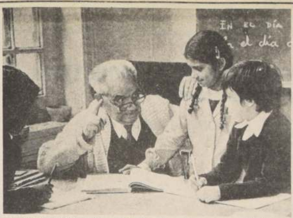
Miles de profesionales, especialmente profesores como el de la fotografía, y médicos, figuran en el registro especializado que para tal efecto abrió el Servicio de Registro Civil e Identificación, luego de la dictación del D.L. 3261, que transformó los Colegios Profesionales en Asociaciones Gremiales.