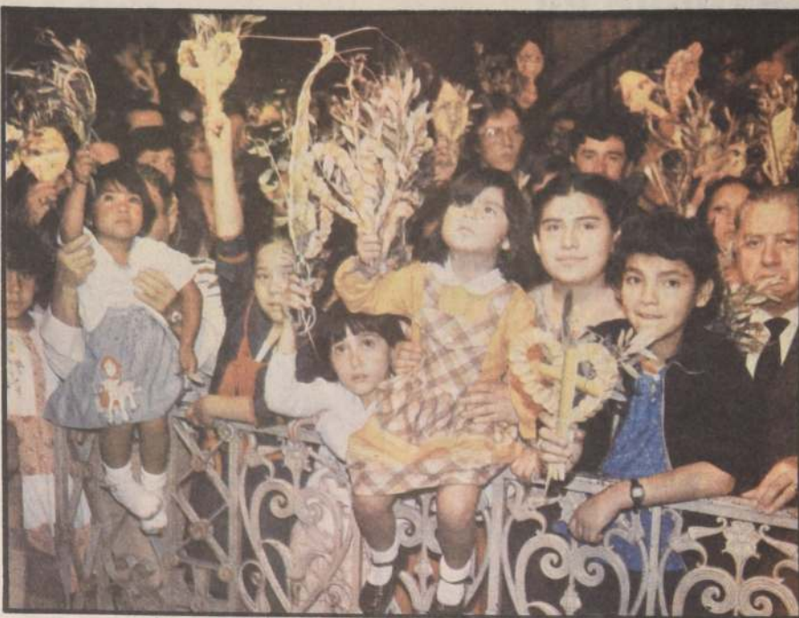
Al igual que lo hicieron hace casi dos mil años, estas niñas levantan sus ramos de palmas y olivos en recuerdo de la llegada de Jesús a Jerusalén. Cristo amó profundamente a los niños y ellas, en reciprocidad, acudieron al llamado del amor del Domingo de Ramos.