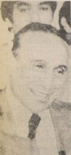
Disfrutó viendo el partido de Perú y Chile. Es más. Tuvo elogios comentarios en Italia para el fútbol chileno, al que calificó como posible sorpresa. Es Enzo Bearzot, un hombre que le pone "al mal tiempo buena cara".

□ Iracundos e implacables, los periodistas italianos han dado una guerra sin cuartel en contra del DT de la "squadra azzurra".