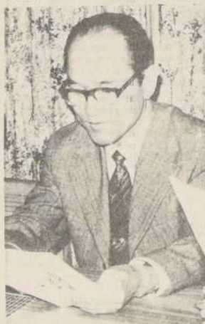
El profesor japonés Tomio Kikuchi, al centro, explica los principios de la macrobiótica en la existencia humana.

Los precios en el único restaurante macrobiótico de Chile, ubicado a un costado del Mercado Providencia, parten de $ 150. Los especiales solo ascienden a 50 ó 60 pesos más que el mencionado. Estos alimentos son preparados de acuerdo al estilo culinario propio de este denominado sistema de vida oriental, que pretende a través del equilibrio mental y físico, encontrar la solución a los grandes problemas de una humanidad tecnificada a tal punto, que seguramente no tenga tiempo de atender a sus postulados.