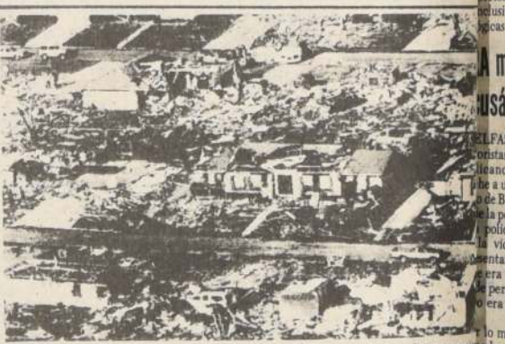
PARIS, Texas. — Fotografía aérea de parte de los daños ocasionados por un tornado en esta población texana.

"Los norteamericanos no deben tener ningún favor al pueblo de El Salvador al presumir de elegirles sus gobernantes tras la comovedora evidencia de un domingo pasado de que los salvadoreños quieren decidir sus propios asuntos. La razón de ser de esas elecciones fue que El Salvador enfrentaba sus propias realidades".