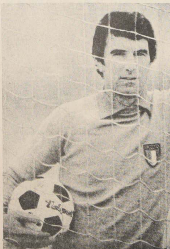
DINO ZOFF. — Casi cien partidos defendiendo a Italia en los tres palos. A los 40 años de edad, puede decir que lleva 35 en el portico.

Bearzot tendrá que depositar confianza en jugadores como Franco Graziani, Roberto Pruzzo o Sesto Altobelli.