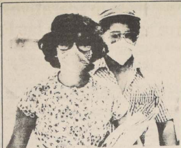
VILLA HERMOSA, México. — Residentes de esta ciudad usan máscaras para protegerse de las cenizas volcánicas que caen a ratos de la erupción del volcán El Chichón, ubicado a cincuenta kilómetros de la localidad.