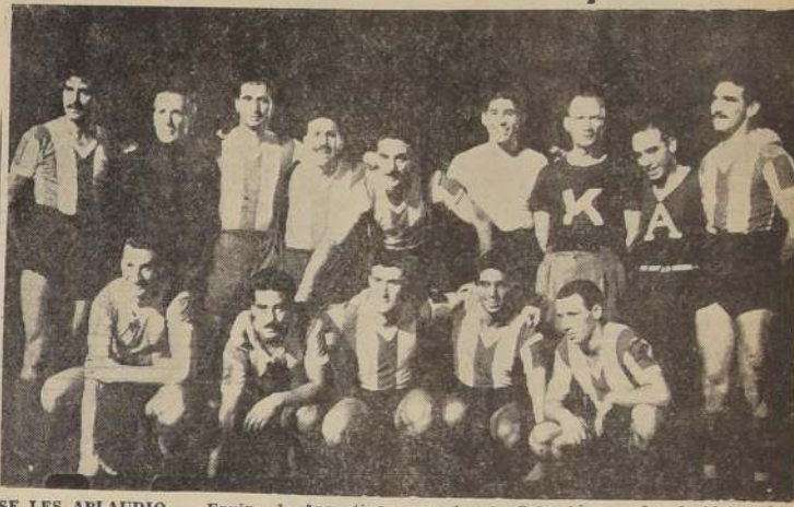
SE LES APLAUDIO. — Equipo de Argentina, vencedor de Colombia por 9 a 1. Al término del encuentro, el público supo premiar la exhibición de los albi celestes.