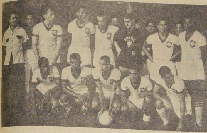
GANO 3 POR 0. — Representación del Brasil, que anoche se impuso en forma concluyente a la de Uruguay, por 3 goles contra 0.