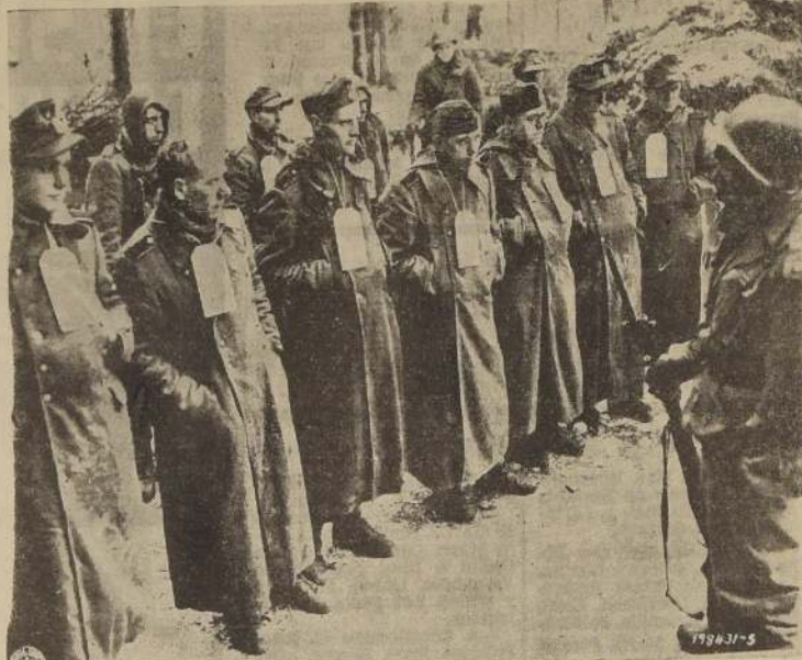
RENDICION.—Prisioneros nazis en occidente, pertenecientes a las S. S., tropas élite del Reich, reclusos entre los efectivos de la Luftwaffe, con sus tarjetas de identificación, después de haber caído en poder de tropas norteamericanas.

El hecho de que se haya formulado una declaración oficial cuando la conferencia está en pleno desarrollo no tiene precedentes; se atribuye a dos factores: primero, la torpeza de la censura en Londres al permitir la publica-