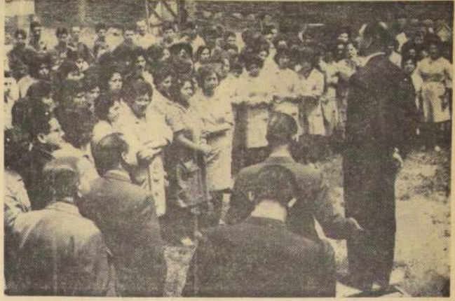
LOS TRABAJADORES de la industria Reicolite de San Miguel aparecen en el grabado escuchando la palabra del candidato nacional a la Presidencia de la República, senador Julio Durán. El abanderado de la democracia recorrió ayer las industrias de San Miguel, compartió con los dirigentes y las bases de los partidos que apoyan su postulación, y por la noche fue objeto de un homenaje en el Club Social de Gran Avenida, consistente en una comida en su honor, que contó con la adhesión de más de mil personas.