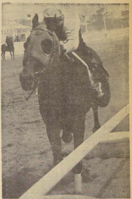
CENCERRO, el crack máximo de las pistas chilenas, viaja el martes a Buenos Aires para participar en los 3.000 metros del Premio Internacional "Carlos Pellegrini" con un primer premio de 10.000.000 de nacionales (240.000.000 de pesos chilenos, más o menos).