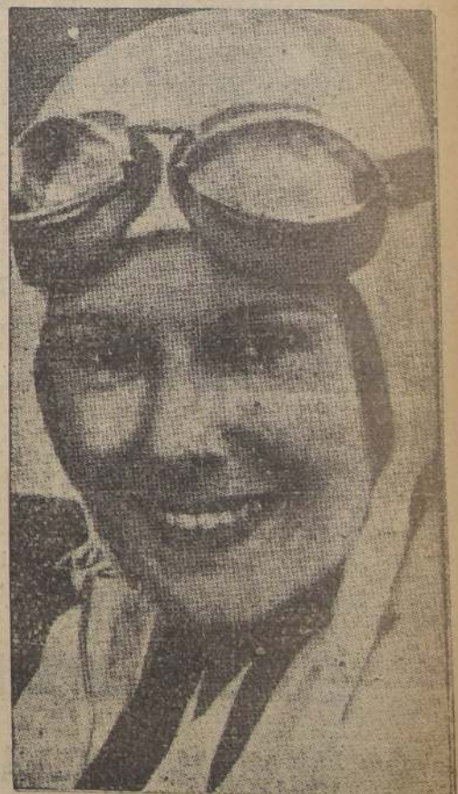
Joan Batten, la hermosa aviadora neozelandesa, que, piloteando un viejo avión y tras fracasar en dos tentativas, batió el record mundial que mantenía Amy Johnson de Mollison para la travesía de Gran Bretaña a Australia.