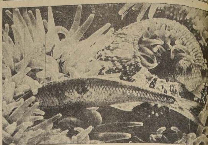
El "pólipo", una planta submarina carnívora, que se alimenta de peces; comienza su captura yendo hacia sí a estos dos grandes ciemolares.