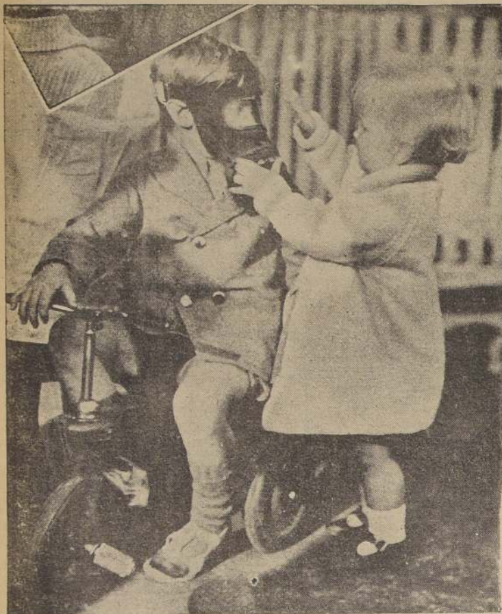
En Londres se está enseñando a los niños a llevar máscaras contra gases para cuando estalle la próxima... Aquí vemos corrigiendo algún defecto de colocación.