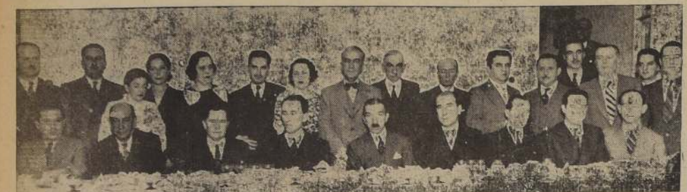
Asistentes a la celebración del 10.º aniversario