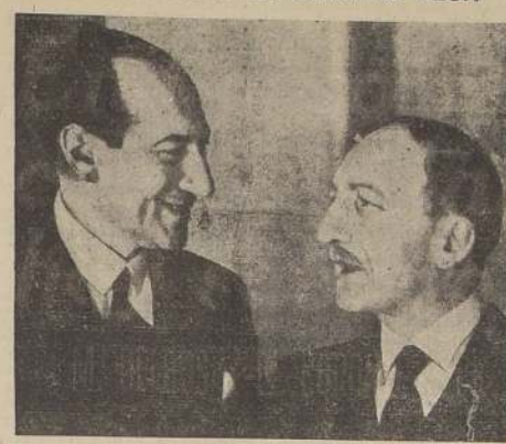
La primera entrevista entre M. Delbos y el coronel Beck, Ministro de Relaciones de Polonia, en su viaje a través de las Repúblicas de la Europa Oriental. (Foto llegada por el correo aéreo de la Air France).