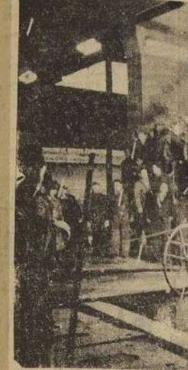
En los momentos en que el Horno "Siemens-Martin" vacía su valioso contenido de metal líquido en la "cuchara" lista para ser trasladada a la cancha en que se formarán los lingotes. Tanto el horno como las demás instalaciones fueron construidas con materiales y obreros chilenos.