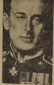
Almirante Lord Louis Mountbatten

las actividades desarrolladas en la organización de la Exposición de Artes Plásticas de Chile, que se enviará a los Estados Unidos de Norte América y un detallado informe sobre la creación del Instituto de Extensión de la Universidad de Chile, recientemente creado por el señor Rector de la Universidad de Chile. A esta reunión se ha invitado especialmente a los se-