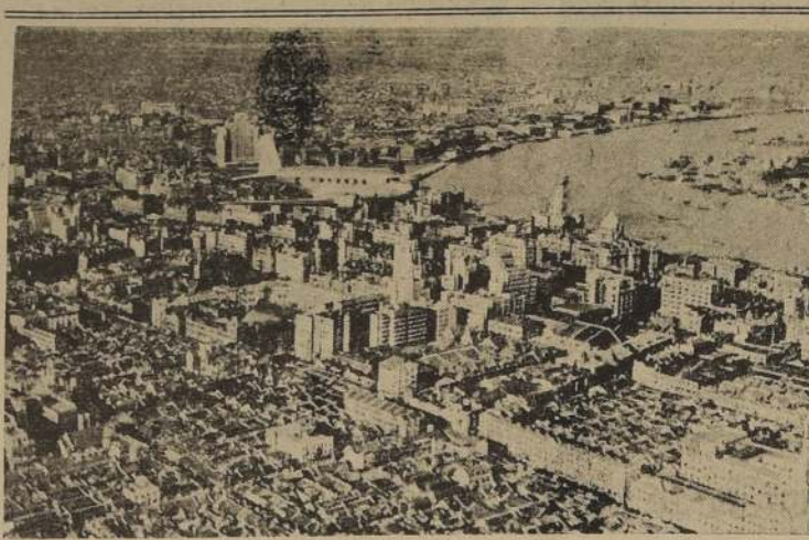
Una vista aérea del puerto chino de Shanghai

Más de 4.000 tons. de bombas lanzaron las Fortalezas sobre sus objetivos