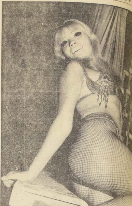
Bibi tiene el aire típico de las Ubilla... Recuerda bastante a la Pítica chica.