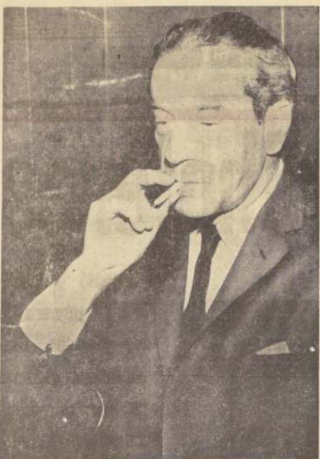
CANCILLER VALDES: Análisis franco de los problemas de América Latina para la próxima década del Desarrollo.

El niño fue trasladado a Santiago e internado en el Hospital Calvo Mackenna, donde fue operado con todo éxito.