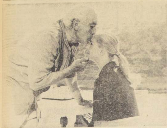
En medio de una compleja búsqueda de un dios fingido, Anthony Quinn, besa en la frente a Candice Bergen.