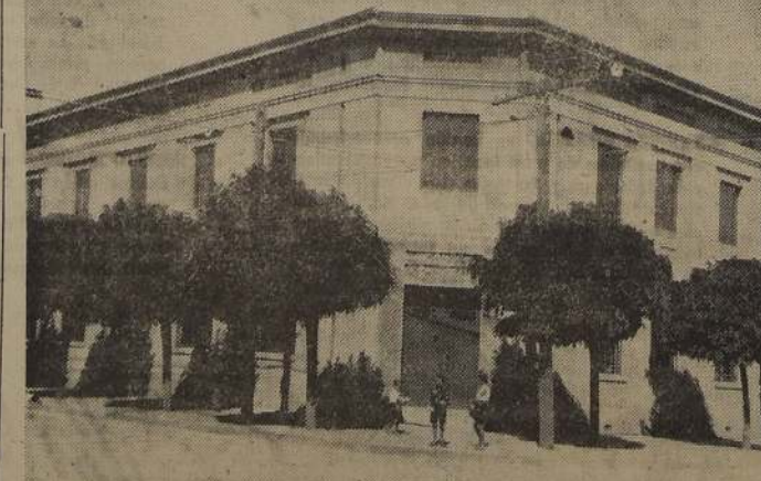
La ciudad se ha modernizado ampliamente. Nuevos edificios y avenidas, plazas y construcciones obreras, hermosean la capital de Malleco