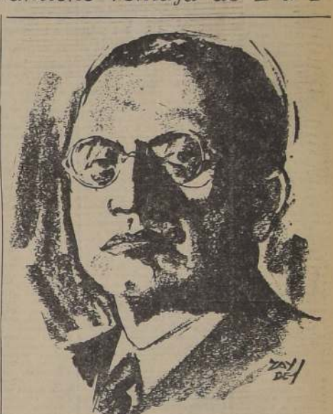
El Premier Alcide de Gasperi, principal triunfador en las elecciones de Italia, quien, según se cree, continuará desempeñando sus altas funciones al frente de un Gabinete semejante al actual.

VOTOS PARA SENADORES El cómputo oficial de votos para senadores, de 31.709 de