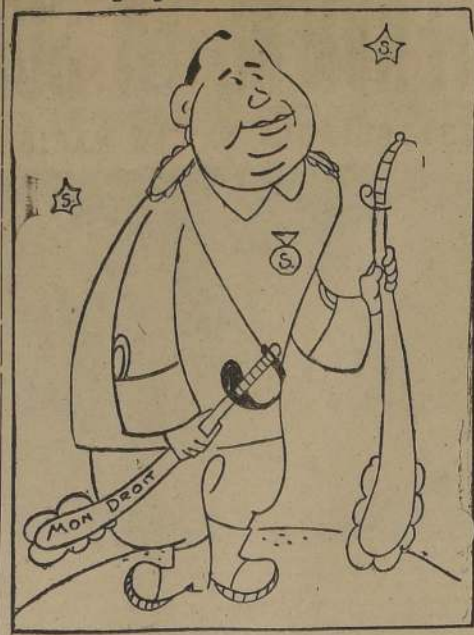
Presidente de Nicaragua, general Anastasio Somoza, cuyas tropas han invadido el territorio costarricense.