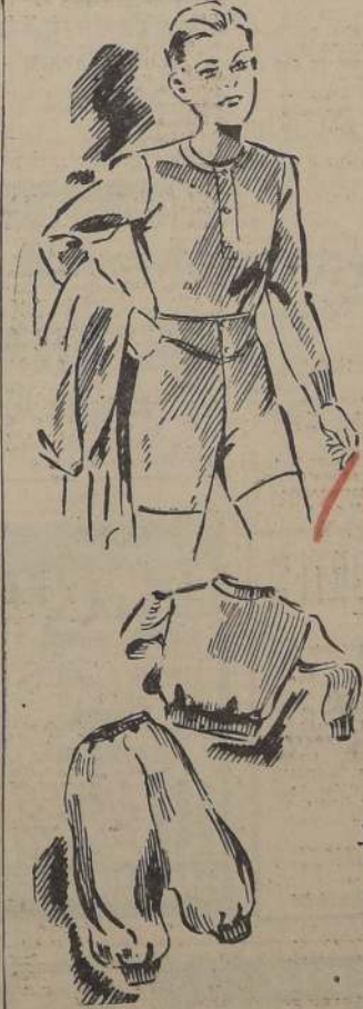
Pedidos Contró: Rancagua, Casilla 75 D, Santiago

La Superintendencia de Aduanas ha llegado ya a un acuerdo con la Liga Marítima de Chile, para la adquisición del edificio en que funciona esta última entidad. Ahora solamente se espera el nombramiento de la comisión que se encargará de la tasación del edificio para la fijación del precio.