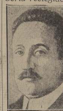
El Presidente De Nicola