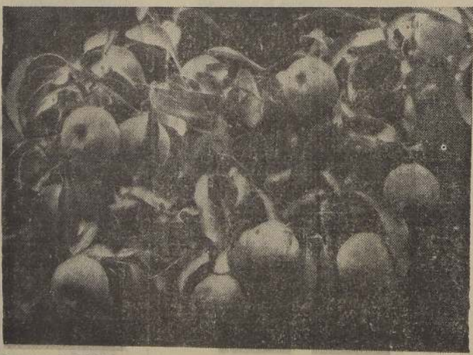
La provincia de Malleco es una de las más ricas en producción frutícola, especialmente de manzanas