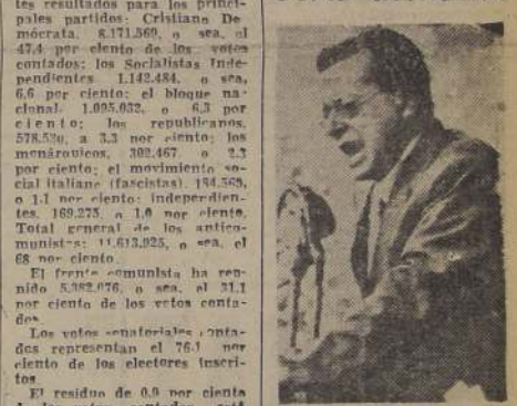
Togliatti, principal dirigente comunista italiano