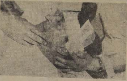
BOGOTÁ.—Los restos del dirigente liberal colombiano Jorge Eliécer Gaitán, yacen sobre la mesa de operaciones en una Clínica de Bogotá, a donde fue llevado después de haber sido mortalmente herido.

"Fue la delegación venezolana y en especial el ex Presidente Betancourt, quienes dieron a nuestro país el más alentador voto de confianza al proponer a los demás miembros de la Conferencia Panamericana que ella sirviera reuniéndose en Bogotá, a pesar de los disturbios ocurridos últimamente."