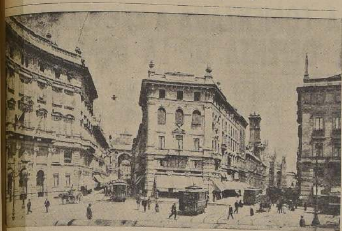
La Plaza de Cordusio en Milán, ciudad en la cual se efectúan concentraciones comunistas

77% de población italiana votó a favor de partidos que apoyan al Gobierno