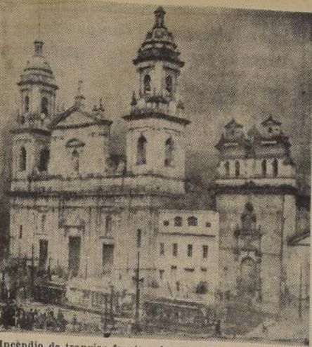
Incendio de tranvías frente a la catedral de Bogotá, templo que sufrió igual suerte poco después.