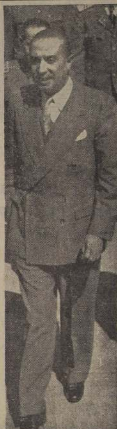
EXCMO. SR. GONZALEZ VIDELA.

Categoricamente afirmó el Primer Mandatario que podía presidir las elecciones con la actual combinación de Gobierno, atendidas las razones anotadas. Así lo hizo don Arturo Alessandri, en la campaña presidencial de don Pedro Aguirre Cerda. En mi propia elección, cuando era Vicepresidente el señor Alfredo Duhalde, quien había sido candidato,