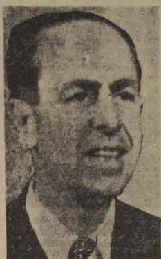
Don Pedro E. Alfonso, abanderado de los partidos de la combinación de Centro-Izquierda, en la lucha presidencial de septiembre próximo.

DESARROLLO DE LA TERMINARIAN PARA BIEN DEL PAÍS. Los problemas de la habitación, alimentación y educación fueron tratados a continuación por el señor Alfonso. Después de recordar las cifras estadísticas acerca del pavoroso problema de la falta de habitaciones, de la falta de locales para dar educación al pueblo y de referirse al rubro alimentación, para lo cual hay que poner en marcha un completo plan de ayuda a la agricultura, reafirmó energicamente que así como los gobiernos radicales han iniciado la industrialización del país, podían abordar la solución de estos otros con decisión y creando una mística nacional con el apoyo del pueblo.