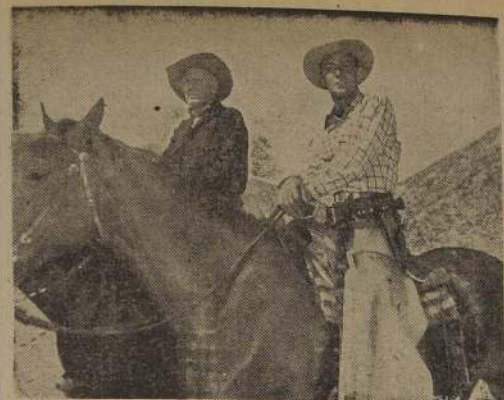
CONTEMPLANDO LA LLANURA.— En esta escena cautivante del film del sello Paramount, en technicolor, titulado "Alma Brava", que el cine Rex estrena hoy, vemos a Alan Ladd contemplando la llanura desde una cima.

Mañana viernes 22 habrá igualmente única función nocturna a las 9.40.