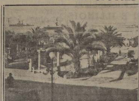
Vista del puerto de Coquimbo

El hecho que fue detenido por la policía, se encuentra con sus facultades mentales perturbadas.