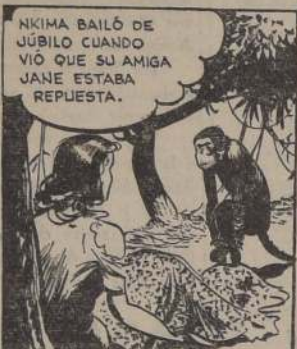
TARZAN ANDABA EN BUSCA DE FIBRAS Y UNA ESPINA PARA SU ESPOSA...