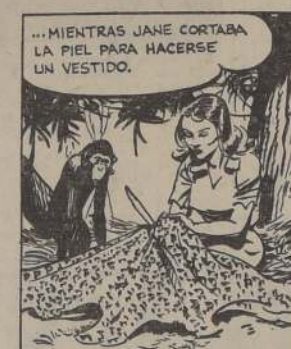
TARZAN ANDABA EN BUSCA DE FIBRAS Y UNA ESPINA PARA SU ESPOSA...