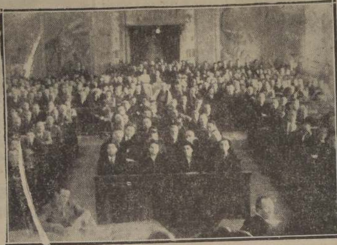
PALERMO, (Sicilia).— Sicilia inaugura su primer Parlamento. Representantes de toda Italia acudieron a la inauguración del parlamento de Sicilia, el primero en la historia de la isla. Este parlamento ha sido el resultado de la eliminación de la monarquía en Italia. (Foto ACME.).