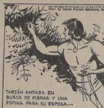
TARZAN ANDABA EN BUSCA DE FIBRAS Y UNA ESPINA PARA SU ESPOSA...