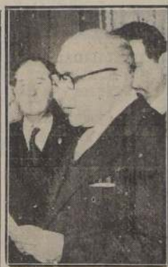
El Excmo. señor Duhalde contesta el discurso de S. E.

Esta prueba tan halagadora de la estimación de mis conciudadanos es para mí, ciertamente, el mejor de los alicientes y la más poderosa fuerza para sobrellevar la grave responsabilidad que vuestra Excelencia ha querido señalarme. No sólo mi natural convicción, sino también las condiciones básicas de nuestro actual régimen político, indican a mi actuación gubernativa un camino de absoluta y leal continuidad con la significación doctrinaria que habéis impreso a la orientación de vuestro Gobierno. Razones de tal entidad, unidas a la afectuosa adhesión de mis conciudadanos y a mi voluntad precisa de interpretar con veracidad vuestros más altos propósitos, me impulsan a mi desempeño un deber primordial entre to-