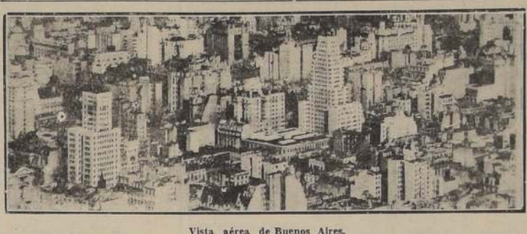
Vista aérea de Buenos Aires.