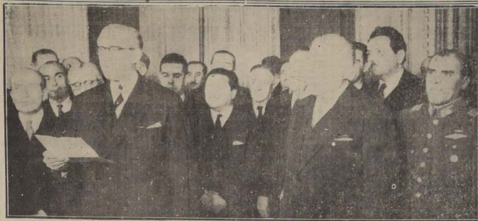
El Excmo. señor Ríos, hace uso de la palabra en los momentos de delegar el Mando Supremo al Excmo. señor Duhalde.

Me alejo del país seguro de que su Mando Supremo queda entregado a manos expertas y a una voluntad sólo guiada por el bien soberano de la patria. Me asiste también la convicción de que los colaboradores que acompañarán al señor Vicepresidente en sus delicadas funciones, harán su tarea con menos graves y más seguras resoluciones de beneficio nacional. Con esta cooperación y con la que de todos vosotros recibo para él en estos momentos, puede el país permanecer en la certeza de que el acto de Gobierno que en estos momentos se realiza, obedece a una inspiración única: la tranquilidad y el bienestar de todos los chilenos."