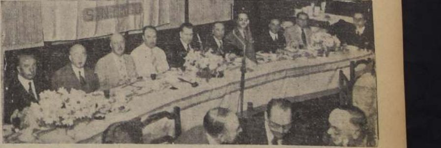
Mesa de honor del almuerzo de ayer del Rotary Club

Retribución del homenaje tributado anteriormente por dicha institución. — Asistieron, especialmente invitados, los Embajadores de México y de Chile en México. — Los discursos