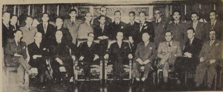
Grupo de asistentes al cocktail que la Revista "Ecuador en Chile" dió en honor de los alumnos del Colegio "Vicente Rocafuerte" de Guayaquil, con motivo de haber triunfado en el concurso literario promovido por el Instituto Nacional de Santiago (14-9-45).