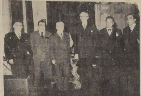
Los directores de la ANEF, durante su visita a S. E.

SU INTERES POR LA DICTACION DEL ESTATUTO ADMINISTRATIVO Y DEL REAJUSTE DE SUELDOS