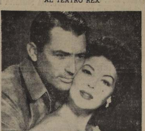
AYA GARDNER, que supo levantar un volcán en el corazón de Gregory Peck.