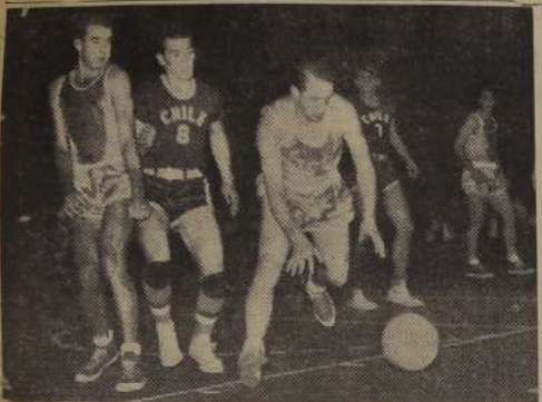
GANARON BIEN LOS URUGUAYOS. — En el partido con los orientales, el equipo nacional no pudo contrarrestar la mejor consistencia de los dueños de casa, que poco a poco fueron aumentando la ventaja, hasta ganar por 52-36. En la foto, los jugadores uruguayos en acción durante el partido.