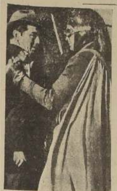
Muy bien recibido por el público de San Diego - Matia - Almagro, ha sido el nuevo plan de innovaciones que para la actual temporada de 1943 ha introducido en sus espectáculos el laborioso y democrático Teatro Caupolicán, de la Empresa Chilena Condor.

Hoy a las 6.20 y 9.30 en triples sabatinos, el Caupolicán exhibe tres films notables... Serial El terror de los espías; el campeón Billy Conn en "Kidd, el boxeador, rompe narices" y Mickey Rooney en "El idilio de Andy Hardy"