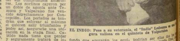
EL INDIO: Pese a su veteranía, el "Indio" Ledesma no logra valiosa en el quinteto de Valparaíso.

CONCEPCION-TEMUCO De interesante desarrollo puede resultar el match de