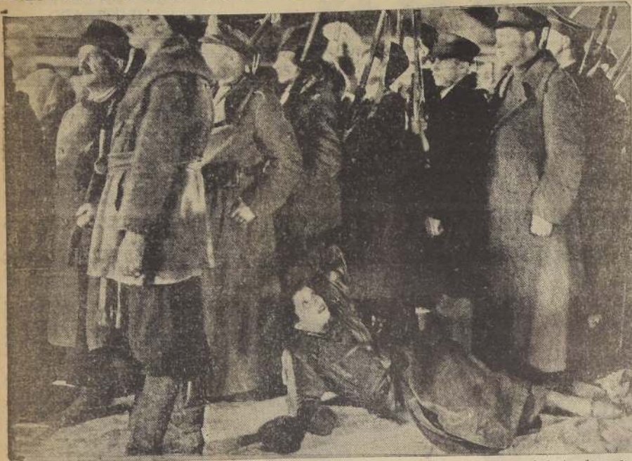
Una escena de la película "Agente Británico", protagonizada por Kay Francis, que se estrenará dentro de poco

FRANCIS LEDERER, NUEVO GALAN JOVEN DE KATHARINE HEPBURN