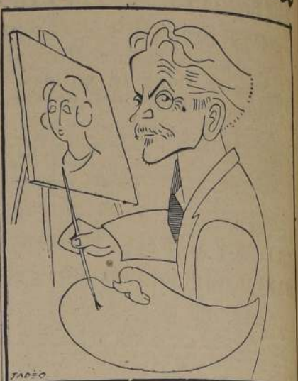
Al cumplirse el primer centenario de su nacimiento, la figura genial de don Juan Francisco González se acrecienta en gloria de pintor y en su prestigio de maestro incomparable.