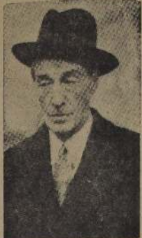
DUQUE DE ALBA

LAUSANA (Suiza). 24.— (U. P.).— En una clínica local falleció hoy el Duque de Alba, ex Embajador de España en Londres y jefe de las familias más prominentes de la nobleza española. El duque, quien forma parte de la corte de la Reina Victoria Eugenia, falleció a las 6.30 P. M. a la edad de 75 años. En media madrugada a la familia se dijo que el duque falleció de un ataque cardíaco. Tenía el corazón débil debido a su avanzada edad. Los miembros de su familia empezaron a llegar esta mañana por avión desde Madrid. Su hermana llegó esta noche, y se espera que se reúnan todos los parientes para hacer los preparativos de los funerales. El Duque de Alba acostumbraba pasar una temporada en Suiza todos los años. Visitaba de preferencia St. Moritz, donde era muy popular.