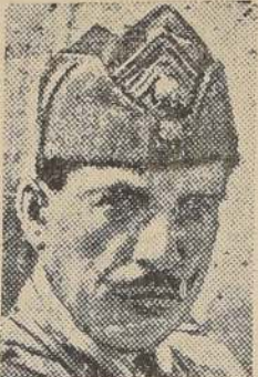
General G. Condylis, presidente del nuevo Consejo de Regencia

Durante esos once años las intrigas y los complots realistas y los golpes de estado en Grecia y en el extranjero han mantenido a Grecia y a los Balcanes en un continuo estado de tensión nerviosa. El ex Rey Jorge nunca ha tomado una parte activa en ninguna de estas tentativas pa-