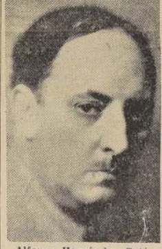
Alfonso Hernández Catá

Como se sabe, el señor Hernández Catá es un escritor de sólido prestigio internacional, y uno de los poetas americanos más conocidos. Su vasta obra literaria le ha conquistado una merecida fama en el mundo de las letras, donde se le reconocen especiales cualidades de forma y estilo.