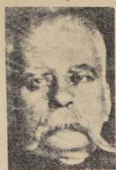
Alexandro Zaimis, el Presidente renunciante

SE SABE QUE EL EX REY JORGE NO DESEA VOLVER AL PAIS HASTA QUE NO SEA LLAMADO POR EL PUEBLO, COMO RESULTADO DE UN PLEBISCITO