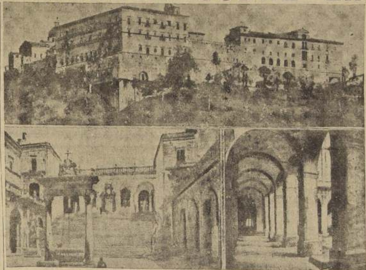
Vistas del Monasterio, situado en la cumbre de Monte Cassino, cuya posesión, junto con la del pueblo del mismo nombre, dieron origen a una de las batallas más costosas y largas del presente conflicto. Los alemanes, al atrincherarse en este secular convento, obligaron a los aliados a destruirlo mediante la aviación y a artillería, el 15 de febrero recién pasado