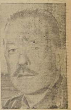
General H. Alexander

SANITARIOS "MERIDA" SURTIDO COMPLETO DE ARTEFACTOS IMPORTADOS Y NACIONALES PRECIOS REBAJADOS ALMACENES DE LA FABRICA "MERIDA" SOLICITE CREDITOS CHACABUTO 8-12-14