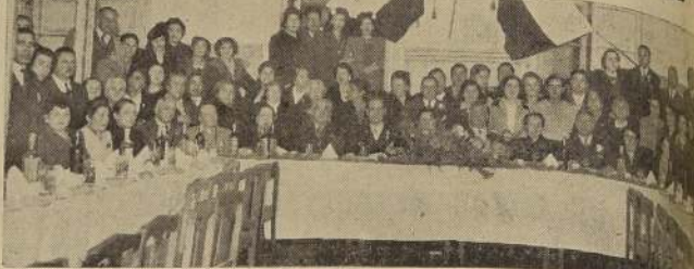
Un aspecto de la fiesta celebrada ayer en conmemoración del 10.º aniversario de la del Centro de Familias de Veteranos del 79, que se efectuó a las 19 horas, en el Salón de la Liga Pro Patria, Nataniel 125. En esta oportunidad, fueron repartidos diplomas y los socios fundadores, y el Directorio dió cuenta de la labor realizada en el último año. En la continuación, se sirvió unas once-comida, que se desarrolló dentro de la mayor camaradería, lándose votos por la prosperidad de la institución.

EL ACTO SE REALIZARA EL DOMINGO A LAS 10.30 HORAS, EN SERRANO 232