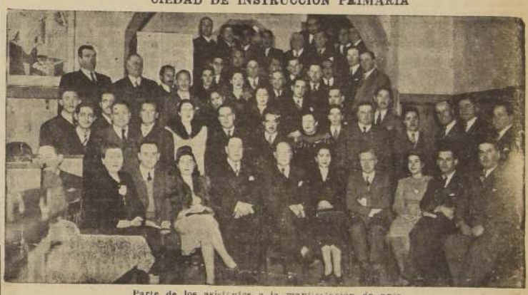
Parte de los asistentes a la manifestación de ayer

CON MOTIVO DE HABER CUMPLIDO 25 AÑOS DE SERVICIOS EN LA SOCIEDAD DE INSTRUCCION PRIMARIA