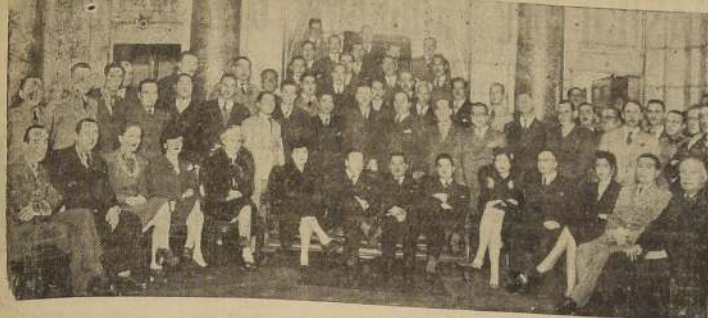
Asistentes a la manifestación al Director de la Penitenciaría