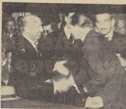
Don Eugenio Matte y don Marmaduke Grove, salúdandose