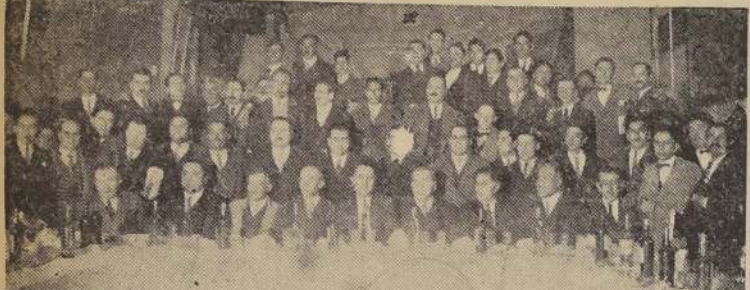
Concurrentes al almuerzo con que la Central de Colonias Agrícolas festejó ayer a los convencionales y dirigentes sociales, que participaron en la asamblea inaugural de la Convención pro Colonización Nacional.