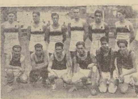
Equipos de basketball del Deportivo Nacional y del Universitario, que hicieron un buen match en que llamó la atención el desempeño del "cinco estudiantil".

Un público numeroso se dio cita en el Estadio de Santa Laura, llevado por el interés que revestían los lances anunciados para ayer, entre los quintos de basket-ball del Universitario con Deportivo Nacional y Unión Deportiva Española con Olea. Vence Universitario.—Las expectativas del "respectable" no fueron defraudadas, pues en el primer lance, a cargo del equipo estudiantil y al desarrollo mismo del encuentro debieron cristalizar en una victoria amplia para el conjunto aurinegro, que ayer, nuevamente ha sufrido en el empate obtenido, las consecuencias de una excesiva confianza.