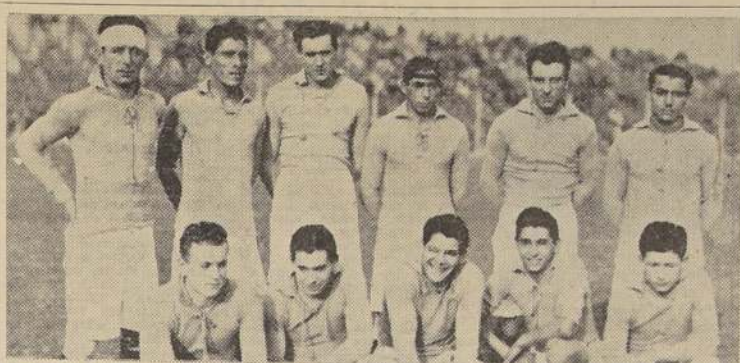
A pesar de su deficiente actuación, el Audax se impuso al L. Wanderers por 4 a 1.