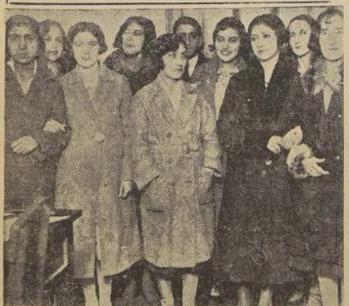
Directorio del Club Deportivo Femenino "Aycaguer y Duhalde", que ha sido fundado recientemente.