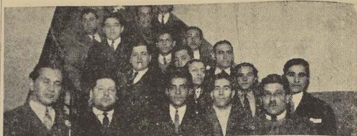
Delegación del "Sindicato Profesional de Empleados de Panaderías", en la visita hecha ayer a nuestro diario, después de celebrar una asamblea en la cual acordó adherir al actual Gobierno y sus reivindicaciones.