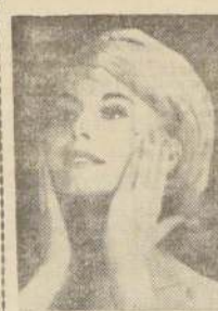
Con pequeños descansos durante el día y una crema adecuada puede subsanarse la sequedad del cutis.