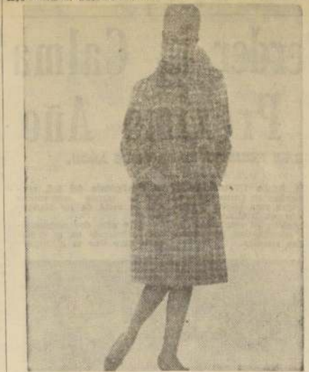
CHRISTIAN DIOR. "CARAVELLE". Vestido de jersey beige de Veron, abrigo de tweed gris y beige de Natif, sombrero, guantes, joyas, cinturones, medias Christian Dior, peinado y adorno de la cabeza, creación Alexandre de Paris.

Hoy, como se ha anunciado, se efectuará el té canasta, a favor de los Centros de Madres de la Obra Social "Diego Portales", en el que se exhibirá un escogido conjunto de modelos de los Gobelins, preparando especialmente para esta ocasión. Se dará comienzo al desfile, a las 16.30 horas en punto.