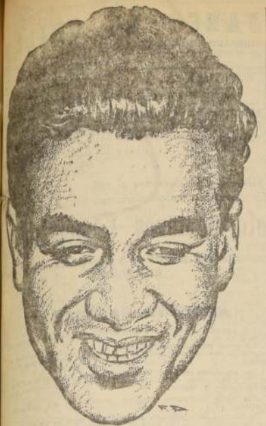
EL SEÑOR ULLA tendrá a su cargo la conducción de Jauja y además de varios ejemplares con primerísima opción.