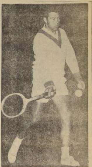
NICOLA PIETRANGELI estuvo dos veces en el equipo italiano que disputó la final de la Copa Davis 1960 y 1961. Son sus mejores galardones, aparte de los títulos de campeón de Roland Garros.