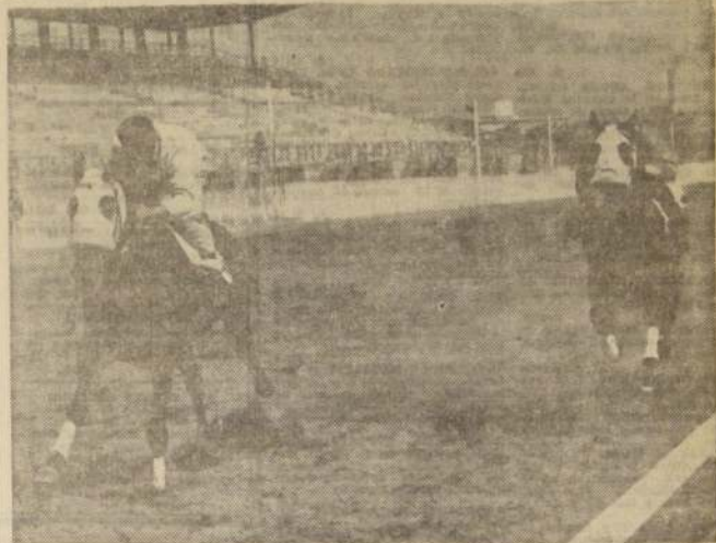
JAUJA, al que vemos apostando junto a Hanganca en la pista del Hipódromo Chile, será de la partida el domingo en el Club