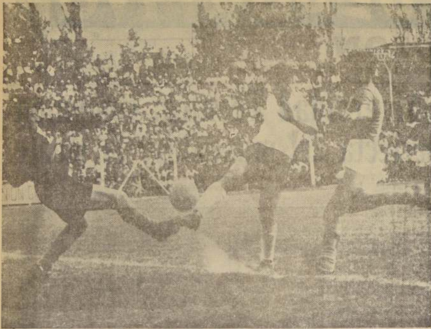
DE LA DEBACLE CALERANA. — Nadie lo pensó, ni imaginó. El 6-3 de Colo Colo sobre Unión Calera deberá figurar entre los resultados sorprendidos. Un reducho inexpugnable, que se de-