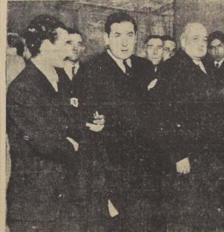
Durante la inauguración de la Exposición de cuadros del pintor vasco, Narkis de Balenciaga, efectuada ayer en el Palacio de Bellas Artes y a la cual asistió el Excmo. Embajador de España, Sr. Rodrigo Soriano.