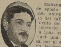
Capitán del Cementerio General, a las 11 horas.