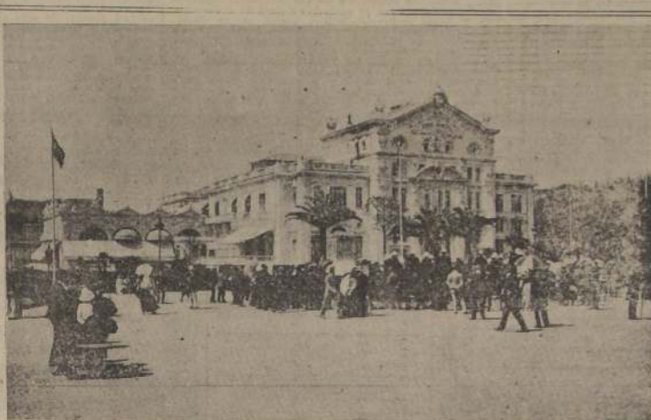
El Casino de Cannes.

¿AVANCE AMERICANO HACIA PARIS POR CHARTRES Y DREUX?