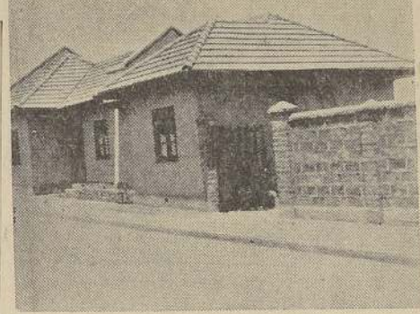
Casas de la población inaugurada ayer

La población, que consta de 90 casas, para el personal subalterno de carabineros, ha sido construida por la Mutualidad de Carabineros.