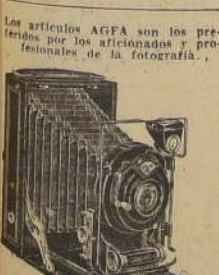
Maquina fotografica 9 x 12 con objetivo 8 x 3 con chasis y bobina de cuerda. Obsequio AGFA-FOTO.

Recorte este aviso del Gran Sorteo de Navidad, patrocinado por las radios