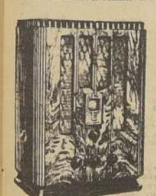
Radio General Electric 1936, con válvulas de acero.