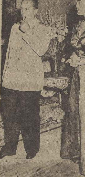
MADAME TITO III, MUJER DE ARMAS TOMAR. — El mariscal Josep Broz Tito, jefe del Estado de Yugoslavia, y su flamante esposa, Jovanka Broz. Es la tercera mujer del mariscal Tito: la primera, rusa, murió en su patria; se divorció de la segunda, una muchacha eslovena, en 1947. La actual "Madame Tito" es alta, muy morena, tiene el grado de mayor del ejército yugoslavo, fue guerrillera y trabajaba en la secretaría del mariscal. Mujer de armas tomar, se distinguió en las luchas de las guerrillas durante toda la guerra.

Gran Bretaña y EE. UU. formarían frente común en cuestión petrolera