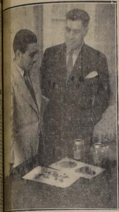
General Alvear, formula declaraciones a un reporter de Nuestro diario

Quedan por ubicar 17,5 kilogramos del total robado