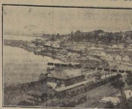
Una vista de la zona portuaria de Talcahuano