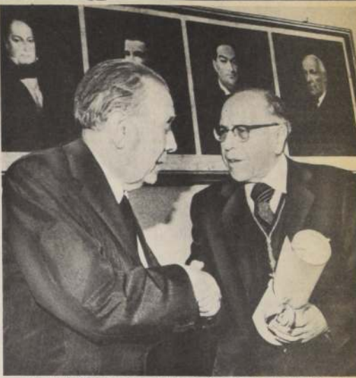
Jorge Luis Borges es uno de los escritores latinoamericanos que más ha influenciado en la literatura de Estados Unidos. En la fotografía, en uno de los homenajes rendido en Chile.