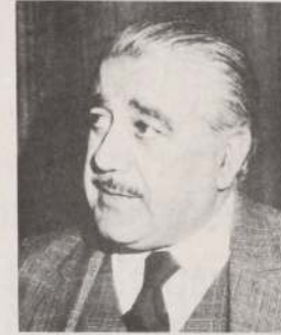
Alcalde de San Esteban, Alberto Catalán.