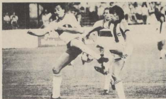
UNIVERSIDAD CATOLICA, puntero del Grupo "A" con 19 puntos, se mide con Atacama y Palestino, subpuntero, enfrenta a Magallanes.