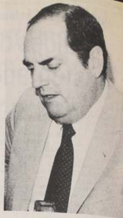
Boris Blanco, Superintendente de Bancos e Instituciones Financieras.

El proceso de repactación de deudas se inició el pasado 22 de abril, y a él concurren más de 100.000 medianos y pequeños deudores a través de todo el país. De acuerdo a las opiniones vertidas por diversos organiz-