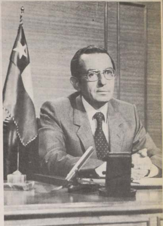
Ministro de Hacienda, Carlos Francisco Cáceres. Pronunció un magno discurso doctrinario sobre la política económica que impulsa el Gobierno.

"Creo que es importante, enfatizó, que en estos momentos difíciles, en los momentos en que comienzan los vendedores de ilusiones a indicarnos la vuelta al pasado, a señalarnos que la intervención del Estado debe ser ma-