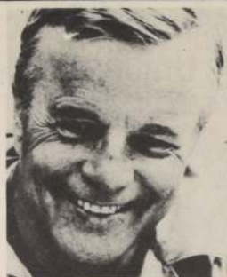
Franco Zeffirelli dirigió la película "La Traviata", que causó elogiosos comentarios luego de su exhibición en el Festival Internacional de Cine de San Francisco.

El pirata Barba Amarilla del relato, encarnado por el cómico Graham Chapman, aterrizó en 1587 la flota española y la francesa. Roba a una especie de santón, el poderoso El Nebuloso, un rico tesoro y lo enterra en una isla tropical. Después de esto lo detienen y condenan a 20 años de cárcel. Al término de su condena, el pirata quiere recuperar el tesoro, pero otros están en su mismo camino y algunos burócratas corruptos deciden alargar su prisión por otros 40 años. Saben que intentará huir y esperan así seguirlo hasta la isla del tesoro. Barba Amarilla tiene un hijo, Dan (Martin Hewitt, el protagonista de "Amor sin fin", de Zeffirelli), que la madre hace pasar por hijo de Lord, un poco tonto (Peter Cook, otro famoso actor cómico). Dan tiene el mapa del tesoro tatuado con precisión en su cráneo. Y así parten todos: el Lord, Dan, un excéntrico médico inglés en busca de hierbas medicinales (Michael Hordard) y Barba Amarilla. Los cuatro se embarcan en el "Bounty", junto a otros dudosos personajes como Moon (Peter Boyle) y Bilbert (Marty Feldman) que también buscan al tesoro. Tras increíbles luchas en el mar se llega a la isla y allí hay más aventuras y también un romance entre Dan y Triola, hija de El Nebuloso (la actriz Stacey Nelkin). Finalmente, en un clima entre filme de capa y espada y la parodia más humorística, se llega al desenlace. Otros nombres famosos en el "cast" de este film son James Mason, John Cleese, Susannah York, Ronald Lacey y Peter Bull.