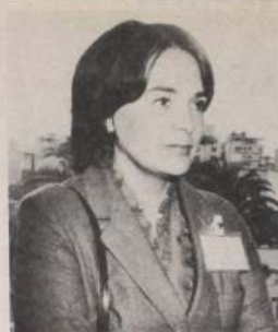
Alcaldesa de El Olivar, María Estrella Montero.