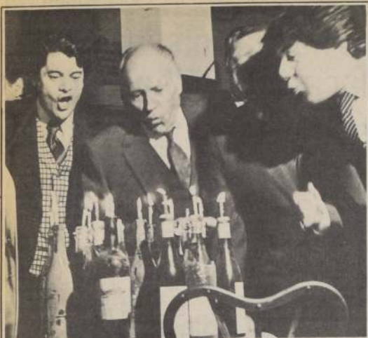
Una "representativa" torta con sus velitas apagan los dueños de la Confitería Torres junto a amigos incondicionales del centenario local.