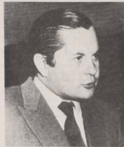
Alcalde de Chillán, Luciano Cruz.