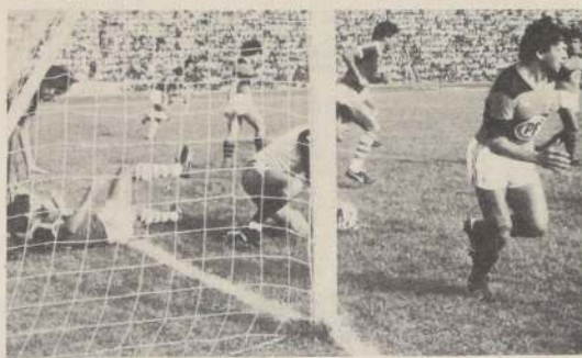
RANGERS, el flamante puntero invicto del Grupo "B", se enfrenta con A. Italiano y Wanderers, el colista, con su tradicional rival, Everton.