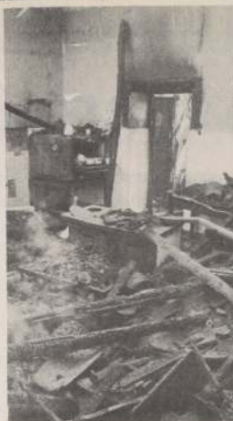
La fotografía muestra la destrucción, por las llamas, del hogar de niñas "San Francisco de Asís", ubicado en Curacaví. En el siniestro dos menores resultaron muertas y una tercera se halla en grave estado por las quemaduras recibidas.

La Intendencia de la Región Metropolitana y el alcalde de María Pinto en horas de la madrugada de ayer se hicieron presentes en el lugar comprobando la magnitud de los daños. La Intendencia entregó una importante ayuda económica en efectivo, y además, coordinó los recursos con la Oficina Nacional de Emergencia, la que proporcionó frazadas, colchonetes y coccinillas suficientes para cubrir la emergencia. SENAMI, por otra parte, posibilitó el traslado de 37 niñas a otros hogares dependientes de la misma congregación.