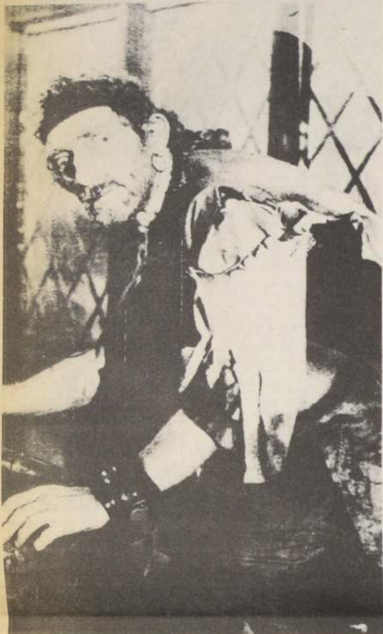
El desaparecido actor Marty Feldman alcanzó a filmar varias escenas de "Barba Amarilla", una película que actualmente se monta en Inglaterra.