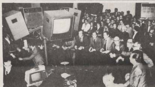
Fue suspendido el remate de acciones en la Bolsa de Comercio.

Por último, Blanco reconoció que hay una tendencia hacia los instrumentos de renta fija, fundamentalmente los fondos mutuos de renta fija, ya que representan una mayor seguridad para el inversionista.