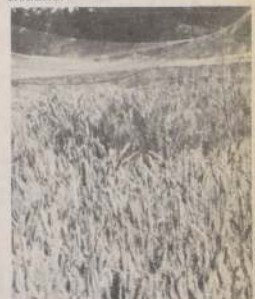
La comercialización de la cebada, materia prima de la cerveza, está siendo entorpecida, según la denuncia del Sindicato de Quiebras, por Maltería Aconcagua, acusada de actitud monopólica.

antecedentes sobre esta materia y con ese propósito pidió comunicarse con los ejecutivos de Maltería Aconcagua. Sin embargo, personal de oficina de dicha empresa se negó terminantemente a proporcionar cualquier antecedente sobre la materia, aduciendo que no estaba facultado para ello. Al requerir el nombre del gerente general, las mismas personas señalaron no estar autorizadas para proporcionar.