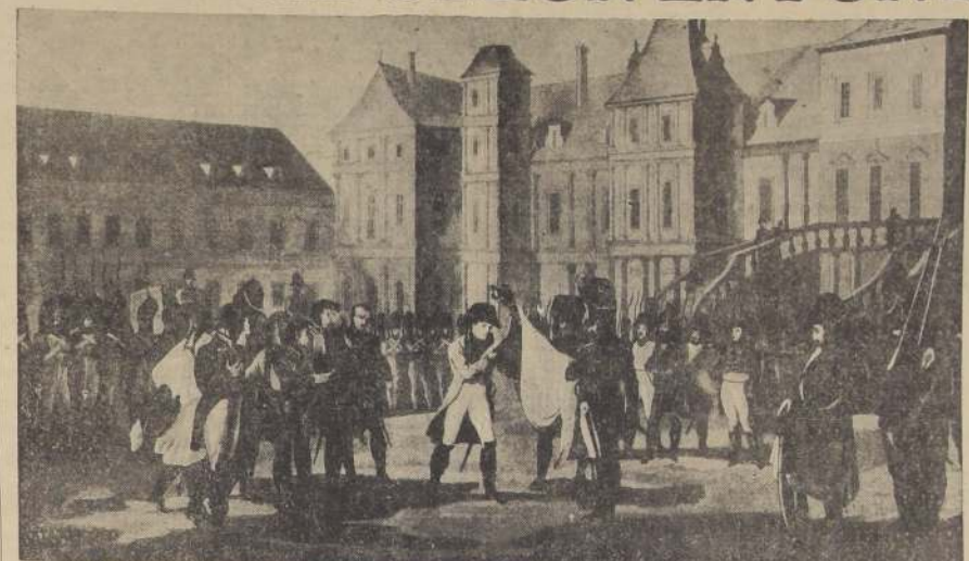
UNO de los incidentes más conmovedores después de la abdicación de Napoleón fue su despedida de sus tropas. La escena tuvo lugar en el patio del palacio de Fontainebleau. Allí se despidió de la Vieja Guardia, y a la altura en el pincel de la gloria. El acontecimiento está mediodía, el 29 de abril de 1814. Tan memorable fue el nombre de "Patio de las Despedidas".

La creación de un personal de esta especie ha influido decisivamente en la menguada o nula representación que el país tiene en mercados donde, por la naturaleza de sus productos, podría haber adquirido una situación ventajosa. Así lo han hecho contar cuantos han observado nuestra posición en el exterior. Es innegable, por ejemplo, que ni siquiera para