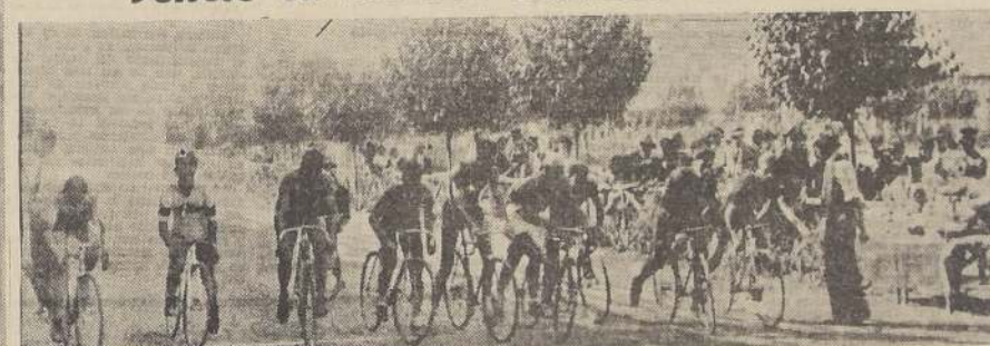
La partida de los cien kilómetros en el Estadio Santa Laura.

Con bastante concurrencia, se llevó a efecto ayer en el Velódromo de Santa Laura, la inauguración oficial de la temporada ciclista de 1935, en pista, a cargo de los entusiastas españoles, los cuales ofrecieron en el campo de su propiedad, un espectáculo de primer orden.