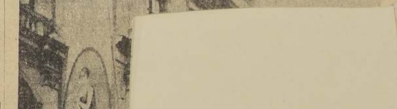
La fachada de la Unión Comercial

En el día de hoy deben iniciarse los trabajos de demolición de la fachada de la Unión Comercial, que se encuentra en la calle Estado. Este edificio, que es uno de los edificios más importantes de la zona de Maipo, será demolido por el Ministerio de Fomento.