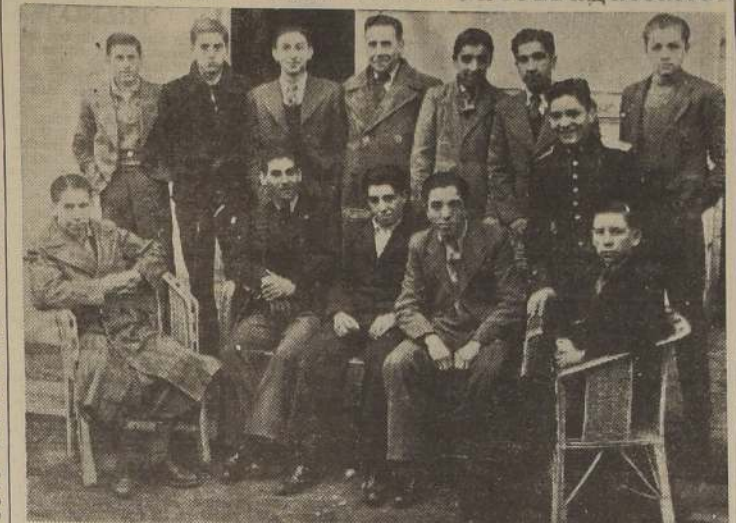
El domingo último el director del Deportivo Magallanes festejó el primer triunfo de su equipo infantil de football de la categoría de 11 años.