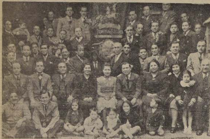
El grabado corresponde a los socios fundadores, antiguos y nuevos dirigentes y entusiastas asociados actuales del Sindicato Profesional de Tapiceros, que celebraron dignamente el décimo aniversario de la creación.

Personal de su Departamento de Arte y Cultura.— La programación de mañana