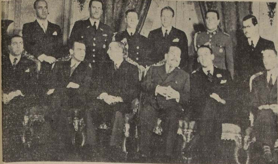
S. E. el Presidente de la República, durante la audiencia que concedió ayer al actor cinematográfico, en misión especial, señor Douglas Fairbanks.

Visitas al Canciller y al Intendente. Manifestación en la Alcaldía. La recepción de esta noche en la Embajada de Estados Unidos