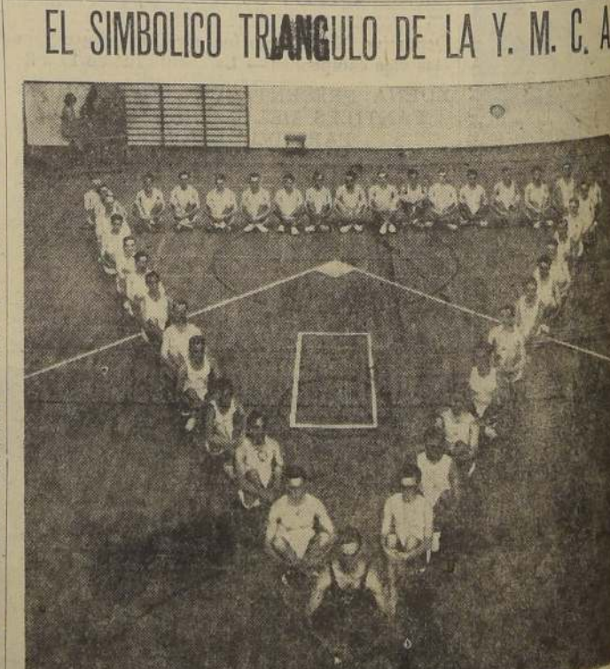
Después de una fuerte clase de gimnasia, donde el corazón ha acelerado su ritmo y los músculos robustos, de estos muchachos, hubo entrada en calor, forman los entusiastas y alegría el simbólico triángulo de la Y. M. C. A., a fin de demostrar que la Asociación lucha por la purificación del Alma, de la Mente y del Cuerpo.