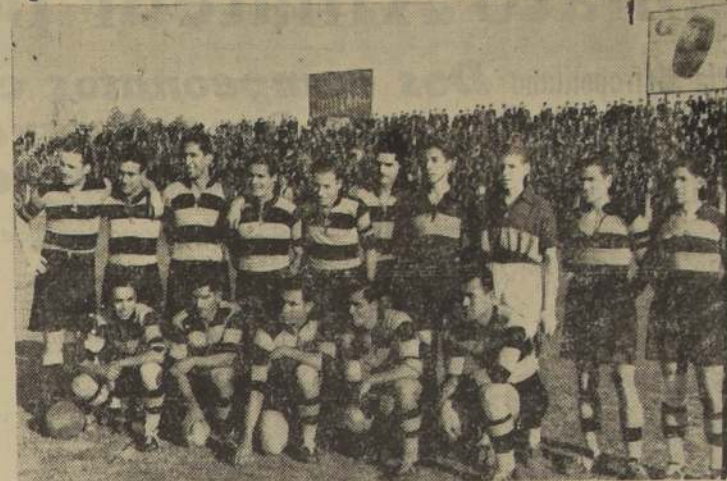
El combinado Badminton-Morning, que ha ta los 75 minutos de juego, dió la sensación de ser el ganador del match

que se hubiera abierto el score y sólo en algunos momentos logró interesar a la concurrencia. En realidad se esperaba que esta contienda resultaría de atracción, por cuanto los antecedentes de los contendores así lo hacían presagiar. Sin embar-