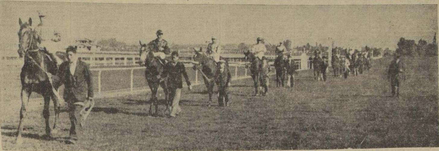
ENCABEZADO EL LOTE POR EL FAVORITO APIRIETITO, LOS COMPETIDORES DE "EL DEBUT" HACEN EL PASEO PRELIMINAR

LAS PRUEBAS ORDINARIAS PRIMERA CARRERA Dió comienzo a la reunión el premio "Almendra", condicional