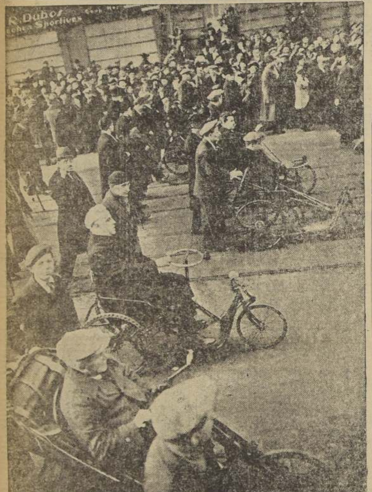
Mitilados de la guerra, en sus carritos, tomando parte en el desfile de desagravio que se verificó en las calles de París, días después del ataque de que fue víctima el diputado socialista León Blum, de parte de los jóvenes miembros de la Acción Francésa.

Por otra parte, hotel para pocos, la selección rigurosa será su lema. No la selección que procura el dinero, con ser éste ya un elemento primordial en un establecimiento cuya estadía no costará menos de 20 dólares por día, sino la selección establecida por la posesión de un nombre que tenga una significación en el mundo de la política, de las finanzas, de la nobleza, del arte o de las ciencias. De esta suerte, los habitantes del castillo de Mittersill vivirán en la parte más hermosa de los Alpes austríacos, en un castillo poblado de viejos recuerdos, rodeados del confort, y el lujo más modernos, y en compañía de hombres notables famosos en los cinco continentes.