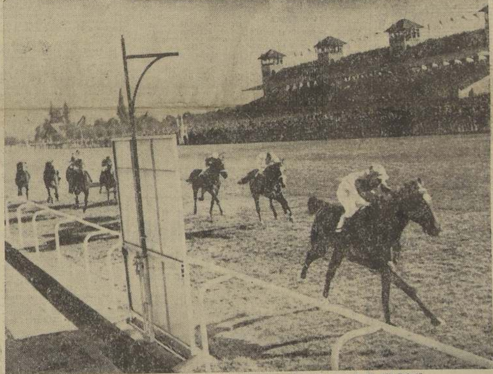
En forma fácil, Aprietito da cuenta de El Alba, Picadora y Musquita, en el Premio "El Debut"

Se comentaba ayer en la cancha, que era poseedor de tres décimos un conocido industrial de esta plaza, quien se retiró del recinto del Club Hípico, inmediatamente de corrida esta competencia.