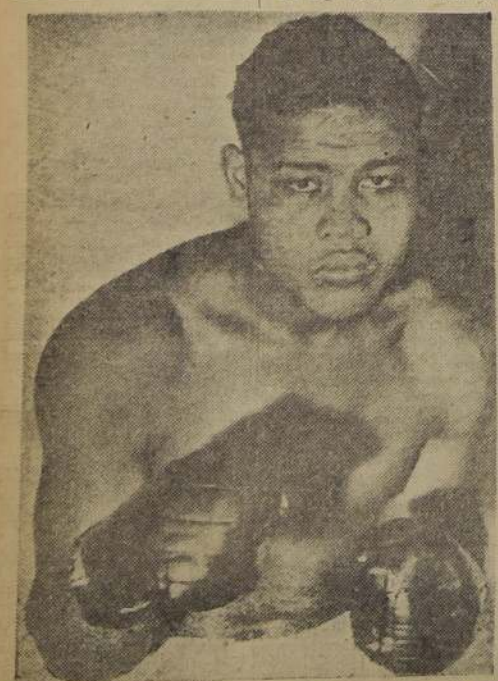
Joe Louis, el formidable negro que ha hecho revivir el entusiasmo por el box en el mundo entero