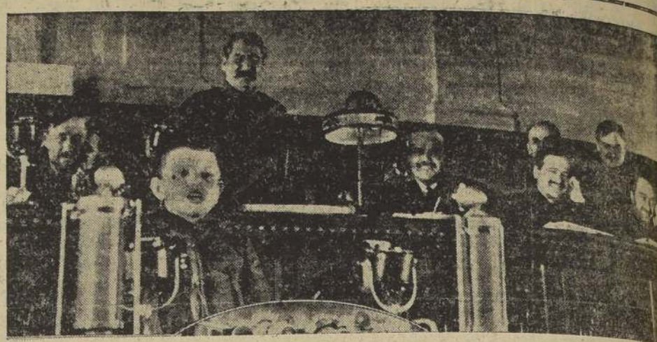
El "pioneer" Misha Kuleshev, de la brigada roja de las haciendas colectivas rusas, da una conferencia por radio, desde Moscú sobre el problema económico de estas haciendas en los Soviets. Stalin está de pie, detrás del niño.