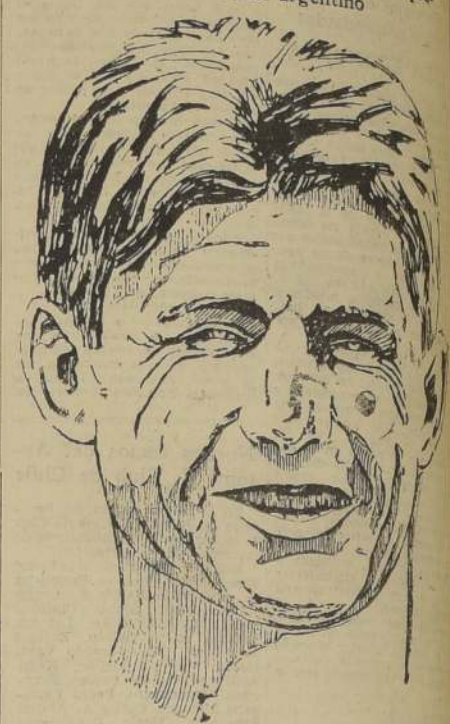
Firpo, el hombre que se propone volver

La Comisión Municipal de Box consumió un año tado al darle el pase.— Lo que fué la presentación del argentino