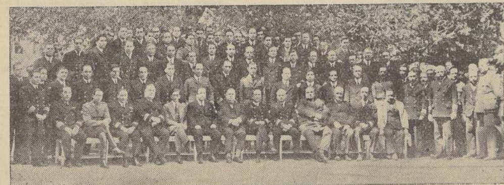
Asistentes a la manifestación en honor del Vicealmirante Reyes

Asistieron a este homenaje los jefes, oficiales de las diversas reparticiones navales. — El Intendente de la Provincia, el Alcalde de Valparaíso y demás autoridades civiles, concurrieron a esta recepción. — Los discursos. — Un saludo de S. E.