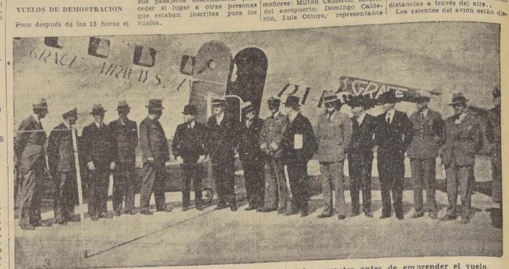
El Comodoro del Aire y otros jefes de la Aviación nacional, momentos antes de emprender el vuelo