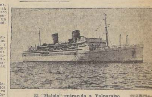
El "Malolo" entrando a Valparaíso

VALPARAISO, 1.º — Alrededor de las 14 horas, zarpó el "Orazio", destinado a Génova, la moto-nave de la Cia. Italiana "Orazio". A bordo del "Orazio" se embarcaron numerosos pasajeros que van a la costa del Pacífico y otros para puertos italianos. Lleva también una gran cantidad de mercancías de primera necesidad. — (Arratia.)