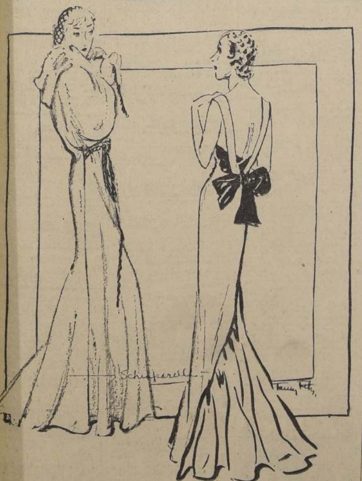
Estas dos creaciones para traje de "soirée" pertenecen a los últimos diseños de Schiaparelli