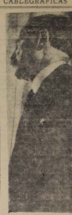
M. León Blum

Durante la semana que pasará en Ginebra, MM. Blum y Delbos conversarán con otros Ministros de Relaciones Exteriores acerca del deseo de apresurar el Pacto del Danubio, el del Mediterráneo y otros pactos regionales en que está basado el plan de seguridad colectiva.