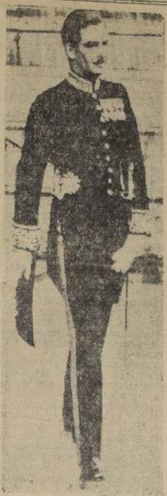
Mr. Anthony Eden