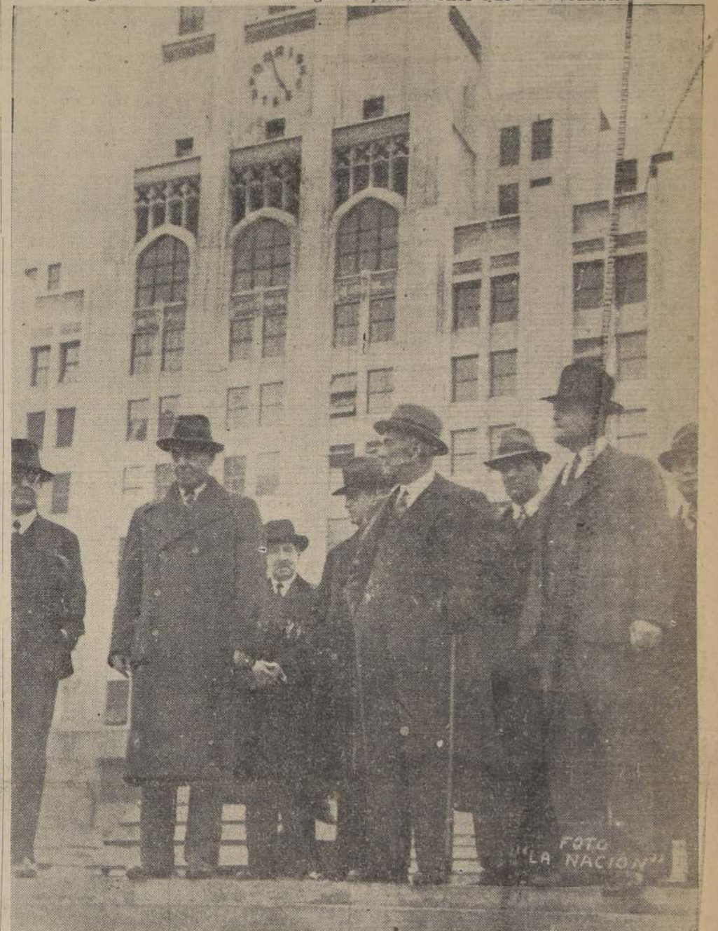
El Ministro de Hacienda, señor Ross, y acompañantes durante su visita de ayer a la Plaza Constitución

Esta plaza será entregada en breve a la ciudad, habilitándose con obras de emergencia.— Se estudiarán algunas plantaciones que la circunden