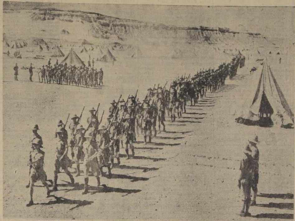
Tropas inglesas abandonando su campamento del desierto, a fin de dirigirse al frente de batalla.