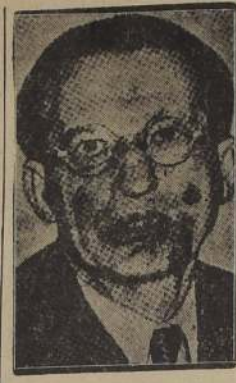
Alcide de Gasperi