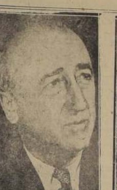
James F. Byrnes