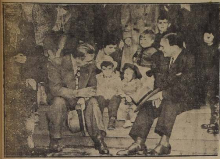
Crisis de viviendas en Estados Unidos. — En Fort Tilden el Gobierno decidió habilitar barracas del Ejército como casas para ex combatientes. — En la foto puede verse el día de la inauguración del proyecto y la ocupación por los nuevos inquilinos. Sentados en los escalones, junto a los niños, están el mayor O'Dwyer y el Gobernador Dewey.

La acusación siguió esta mañana insistiendo en el tema de la colaboración de los comandantes de Mihailovich, al declarar por cuarto día consecutivo el líder de los chekniks, acusado de alta traición. Se logró la admisión por el acusado ayer, de que sólo en media docena de días de 40 de sus comandantes no eran colaboradores. Hoy, tratando de probar que incluso estos seis eran colaboradores, el fiscal dijo: "Le advierto que hay pruebas en forma de telegramas, contra esos hombres. Por ejemplo,