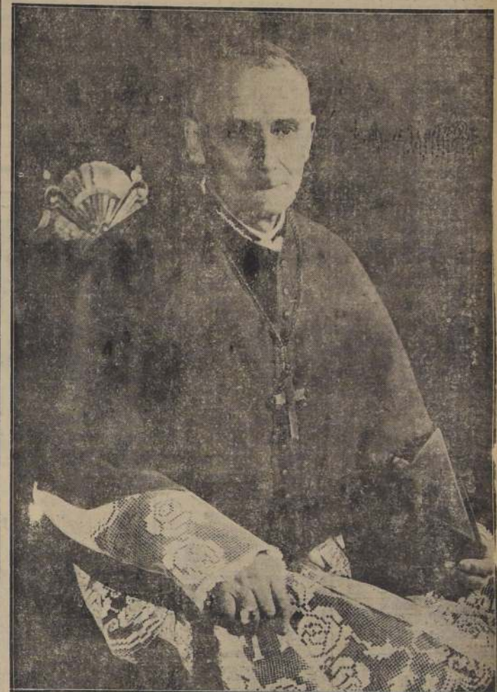
Su Eminencia el Cardenal don José María Caro Rodríguez