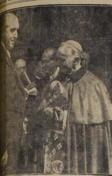
Cardenal Caro, recibiendo en la Iglesia Catedral al Pre-lado de la República, Excmo. señor Ríos, con ocasión de Te Deum.

EL CENTRO DE EMPLEADOS CATORCEÑOS.—Invita a todos los empleados particulares, fiscales y similiares, a participar en la recepción que hoy-hará