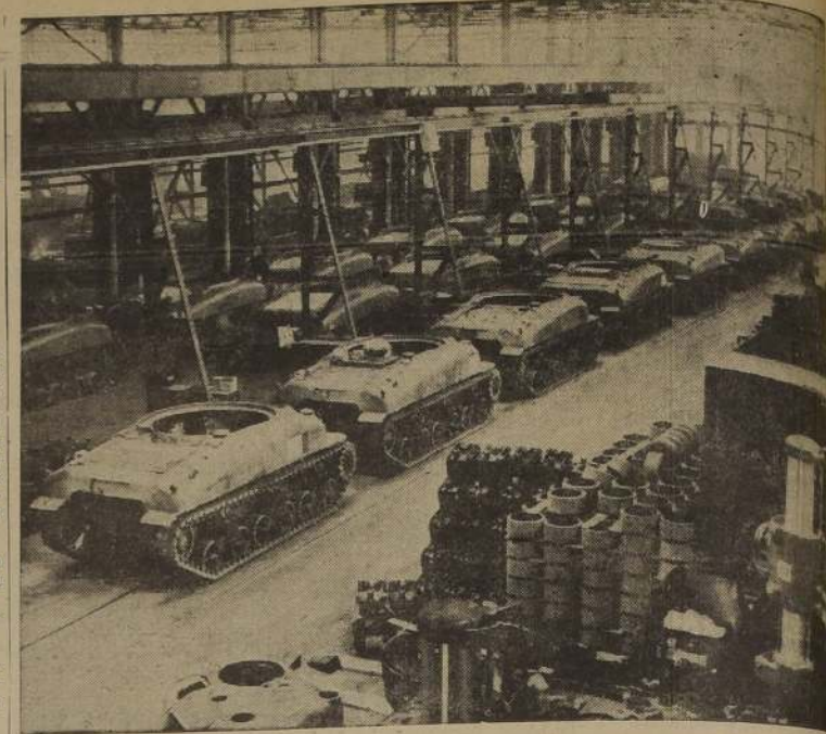
Aspecto que presenta una fábrica de Estados Unidos, que producía antes artículos para uso de la población civil, y que hoy día se dedica enteramente a construir, para las fuerzas armadas, el nuevo modelo de tanques de gran velocidad y potencia de fuego.

He aquí algunos rasgos del hombre más poderoso de los Estados Unidos en cuanto a producción de armas para las Democracias se refiere.