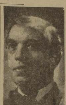
Enrique Soro, el estrafalario ni al desorden formal. El público culto se apresura a rendir al maestro Soro el homenaje que merece cuando se ejecuten, hoy día, sus tientos sinfónicos.

En efecto, se trata de producciones maestras en su género, orquestadas con ciencia suma y armonizadas con elementos modernos, pero sin concesiones a la moda.