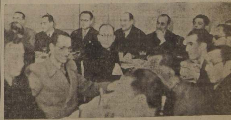
Durante la manifestación en honor del señor Bustos.

En los Salones de la Sociedad Nacional de Profesores se efectuó en la tarde de ayer la comida que el profesorado del Liceo de Hombres N.º 3 de Aplicación ofreció en honor del Ministro de Educación, señor Oscar Bustos.