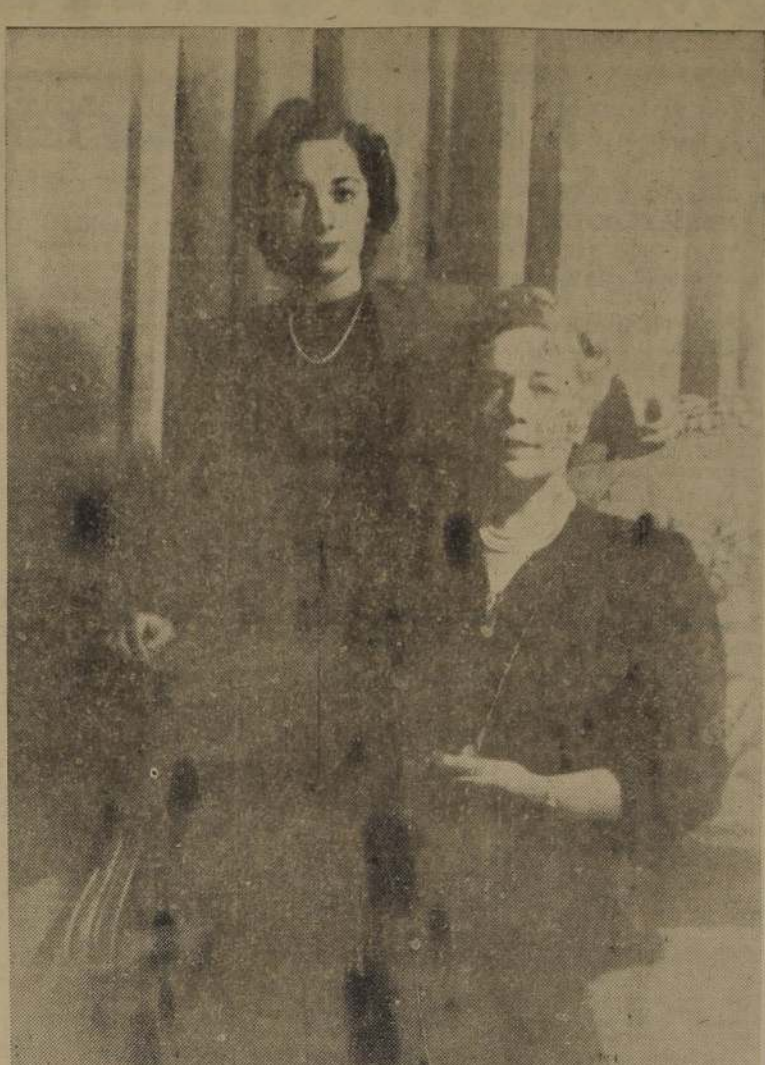
Señora de Bowers, esposa del Excmo. Embajador de Estados Unidos, y su hija señorita Patricia Bowers