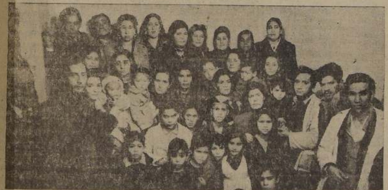
Comerciantes ambulantes que visitaron LA NACION

Son 140 las personas afectadas que no pueden dedicarse a estas actividades en el radio central