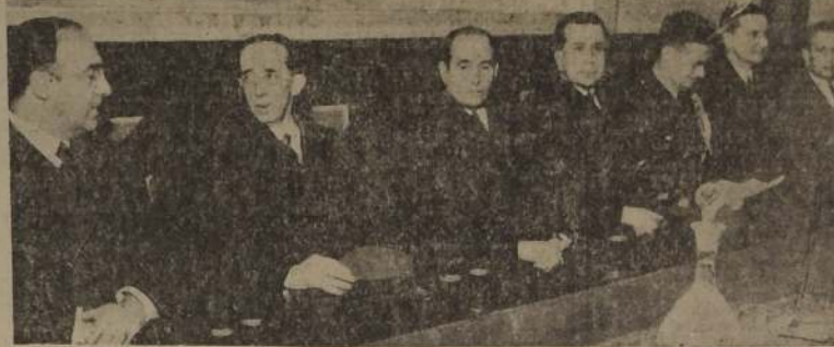
Mesa directiva que presidió el acto de ayer en homenaje a Estados Unidos

El presidente y el vicepresidente, don Fernando Alessandri Rodríguez y don Ladislao Errázuriz Pereira, respectivamente, se entrevistaron en la tarde con el Canciller señor Barros Jarpa, para tratar sobre la participación de los parlamentarios de esta entidad política en el despacho de los mensajes sobre nombramiento diplomático.