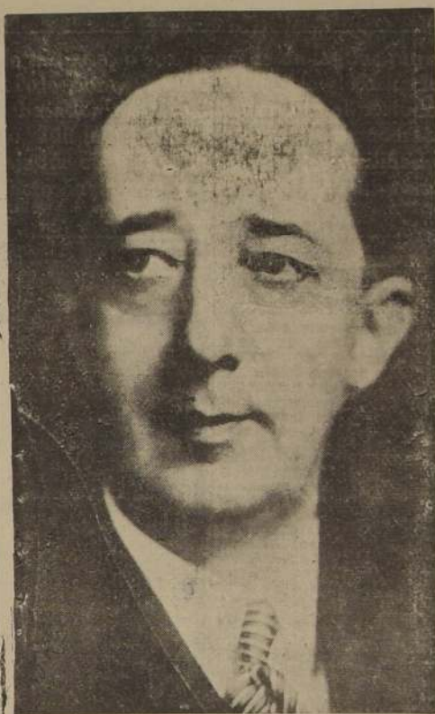
Excmo. señor Claude G. Bowers, Embajador de Estados Unidos de América

Es oriundo del Estado de Indiana, o sea, procede de la más pura cepa norteamericana. —Escritor y periodista de nota, redactor del "New York Herald" y del "New York Journal".— Embajador en España, durante el periodo de la Revolución. Ha escrito un libro, aún inédito, sobre la lucha democrático-totalitaria en ese país.— Embajador en Chile, su cultura y afabilidad como sus sentimientos de afecto hacia esta tierra, le han granjeado generales simpatías