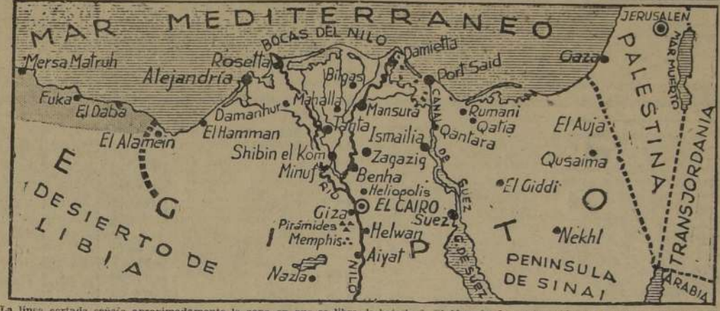
La línea cortada senala aproximadamente la zona en que se libra la batalla de El Alamein. La parte sombreada corresponde al sector de la costa ocupado por las fuerzas de Rommel, en su avance sobre Egipto.

En esta ocasión, el sitio de Sebastopol duró ocho meses, siendo que el de la guerra del siglo pasado fue de once meses; pero no hay comparación posible entre éste y cualquier otro de la historia, ya que durante semanas fué concentrado, sobre la antigua base, todo el infierno de fuego y acero que podían lanzar las modernas armas de Hitler.