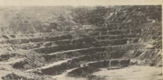
La recesión mundial afectó fundamentalmente al sector minero, a pesar de ello la producción chilena ha sido de vital importancia para nuestra economía.

No obstante, tampoco podía pos- tergarse una solución jurídica que de acuerdo con el principio de la subsi- diariedad —tan fundamental para el esquema económico que el Supremo Gobierno ha implantado— volviera a dar cabida en el campo de la explo- tación minera al sector privado, para que contribuyera con su imprescin- dible aporte de capitales y de tecnolo- gía.