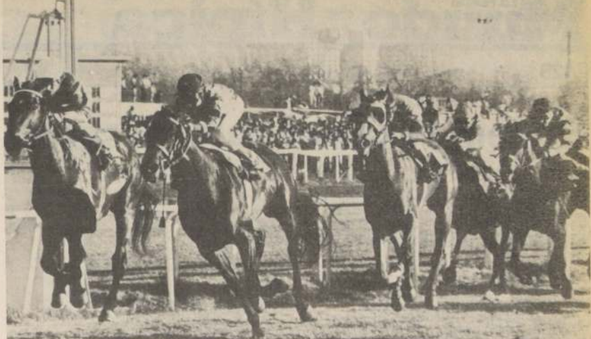
MOLIERE: pensionista de Juan Cavieres Acevedo, luce en gran estado y puede constituirse en uno de los serios rivales en el Clásico Royal Champion de 1.300 metros en la capital.