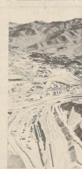
Ampliación de la Concentradora en el mineral El Salvador. El desarrollo minero le permitirá a Chile acelerar el ritmo de cre- cimiento del Producto Nacional

Este Ministerio ha recibido pre- cisas instrucciones de S.E. el Presidente de la República que para que, a la mayor brevedad, se dé término a la redacción de ese Código, la que debe- rá conformarse enteramente a la