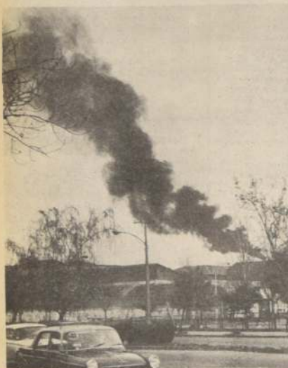
Preocupado del saneamiento del medio ambiente estará en 1982 el Ministerio de Salud por iniciativa del Gobierno.

Entre las tareas específicas propuestas por el Supremo Gobierno, al Ministerio de Salud para 1982, se encuentran las acciones sobre el ambiente, aspecto destinado a complementar la atención sobre las personas, considerando la influencia que ejerce el medio ambiente en el nivel sanitario de la población.