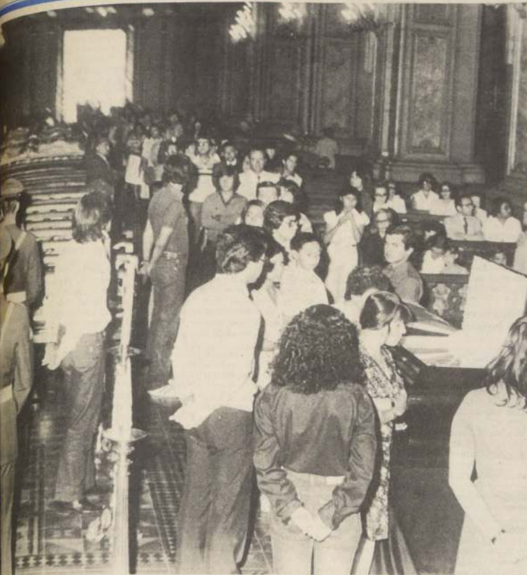
Cientos de personas han desfilado ante el féretro que contiene los restos del ex Presidente de la República, Eduardo Frei, en la nave principal de la Catedral Metropolitana. Por disposición gubernativa, en torno a la urna montan guardia de honor cadetes de las cuatro ramas de las Fuerzas Armadas.

SANTIAGO DE CHILE Domingo 24 de Enero de 1982 Nº 21.042-Año-LXVI 18 Pesos Cuerpo A Ejemplar no vendible