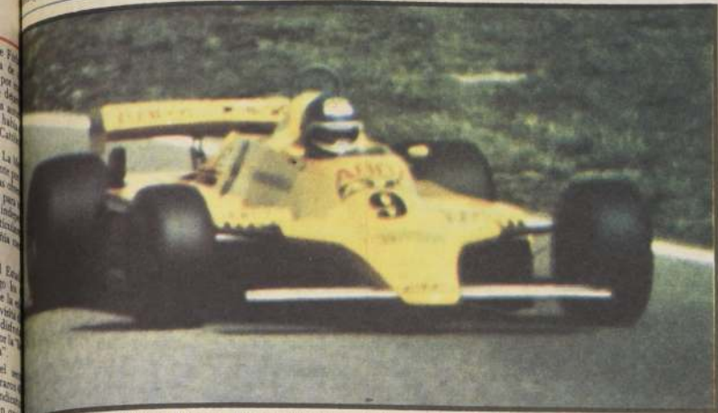
El piloto chileno Eliseo Salazar fue considerado unánimemente entre las sorpresas gratas de la jornada en Sudáfrica, al volante de su nuevo coche de la Escudería ATS. Pese a que tuvo problemas de neumáticos promediando el Gran Premio de Kyalami, al final consiguió una excelente clasificación.