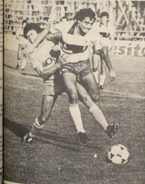
Así se jugó el encuentro entre Universidad Católica y Deportes Iquique en el Estadio Santa Laura. Como resultado de la abrumadora victoria hubo tres expulsados.

EQUITACION DEL MAR (especial). — Aranda de la Escuela de Caballería en "Honey Blue" ganó la "recorrido con obstáculos" a