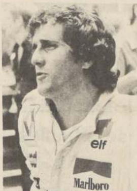
ALAIN PROST, el pequeño gran piloto de la Renault, confirmó en Kyalami que es el gran favorito para este año, como lo dijo hace pocos días Carlos Alberto Reutemann que le escoltó en el primer Gran Premio Fórmula Uno.

por otra parte, confirmó los pronósticos previos que indicaban una neta superioridad de los motores turbo en