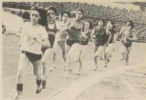
El estado nutricional de los atletas incide directamente en su rendimiento.

El alcalde de la comuna co-El alcalde de la comuna co-El alcalde de la comuna co-