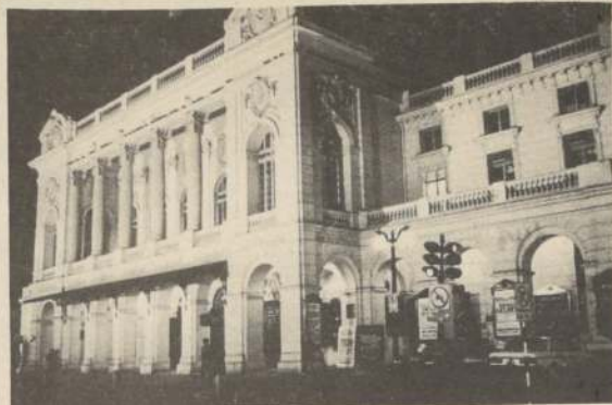
El Teatro Municipal, al cumplir 125 años, presentará espectáculos del más alto nivel mundial.

Por último, el Ministerio de Salud, colaborará con el de Justicia, en la proposición de un sistema expedito para la realización de los peritajes médicos-legales en las regiones, atendiendo a su preocupación de crear un servicio de salud, destinado fundamentalmente a la atención de casos de accidentes.