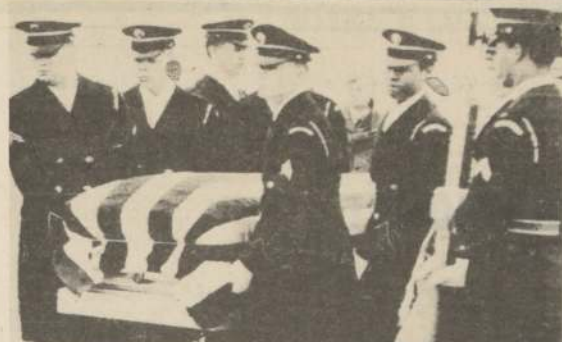
WASHINGTON (AP).— Los restos del teniente coronel Charles R. Ray, el Agregado Militar estadounidense asesinado en París el lunes, recibieron ayer sepultura con plenos honores militares en el Cementerio Nacional de Arlington. El ataúd del militar llegó al cementerio a bordo de una carreta arrastrada por seis caballos negros.

Donde continuaremos atendiendo: Recepción, Entrega de Cargas y Equipajes