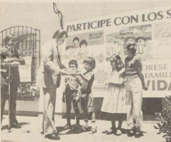
Tanto la captación de fondos previsionales, como la inversión en el mercado por parte de las AFP, experimentarán un importante incremento en los próximos años.

El conjunto de empresas consideradas, en suma, reflejan claramente la situación de extraordinaria bonanza observada por el sector en 1980. El Balance de 1981 deberá recoger la magnitud e incidencia de los problemas que han debido enfrentar en los últimos tres meses del año.