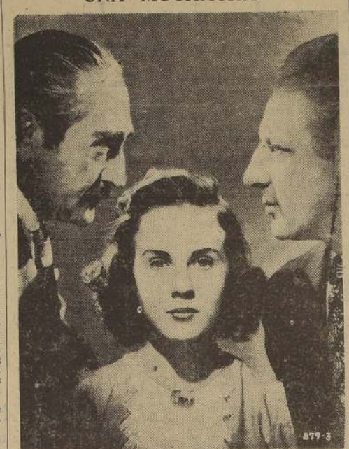
Deanna Durbin, reaparece en nuestras pantallas en "Cien hombres y una muchacha", con Menjou y el director Stokowski

El reestreno de "Cien hombres y una muchacha" va a permitir a nuestro culto público admirar a Leopoldo Stokowski, que desgraciadamente no viniera a Chile en su actual gira por los países de Sud América. El célebre director, en unión de Adolphe Menjou, Alice Brady, Mischa Auer y Eugene Pallette, forman lo más sobresaliente del elenco de este film, que capitanea la gracia y el seductor encanto de Deanna Durbin.