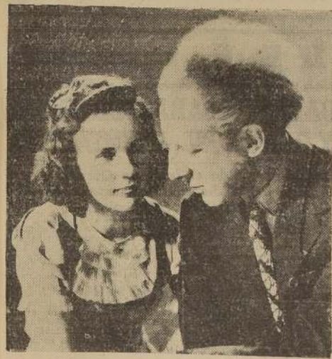
Deanna Durbin y Stokowski, reaparecen en la maravillosa película Universal "CINCO HOMBRES Y UNA MUJER", que desde el martes próximo exhibirá la Sala Cervantes

Deanna Durbin reaparece en Sala Cervantes y en su mejor película