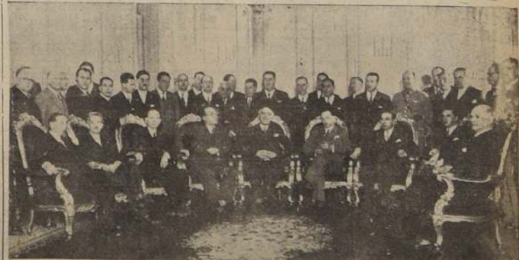
Durante la visita al Excmo. señor Ríos

FUERON ACOMPAÑADAS POR DIPLOMATICOS DE CADA PAIS