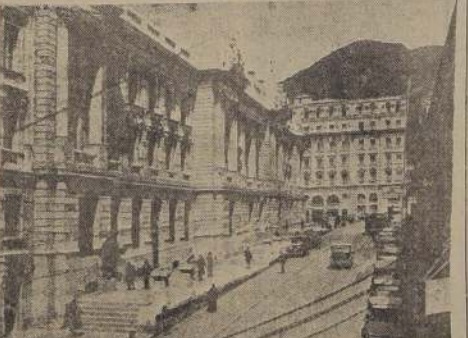
La calle 15 de Bogotá. A la izquierda, la Gobernación de Cundinamarca, y al fondo, el Hotel Granada.