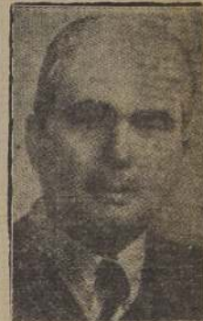
El Presidente Ospina, que inau- gurará la Conferencia

BOGOTÁ, 29. (U. P.).— (Por Jorge Bravo).— A partir de mañana martes y durante seis u ocho semanas, se reunirán en la capital de Colombia mas de 400 delegados, en represen- tación de 21 naciones america- nas, en su novena conferencia regional, destinada a tratar los problemas comunes, algunos de los cuales se destacan por la importancia que tendrán en el futuro de la convivencia conti- nental. Las actividades de esta reu- nión, que fue postergada tres veces, se iniciarán a las 16 ho- ras, con una sesión en el lla- mado Salón Elíptico del Capito- lio, reanudándose así el ciclo periódico de deliberaciones co-