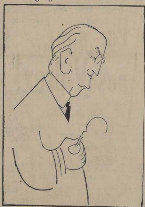
Mr. Warren Austin, delegado yanqui en la NU, quien ha presentado el proyecto de una comisión fiduciaria para Palestina.