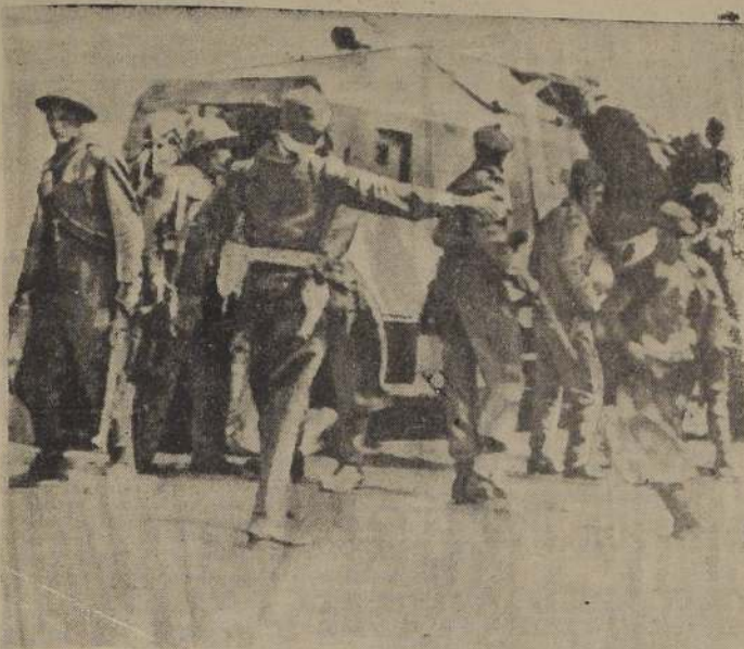
JERUSALEN.—Arabes tienden emboscada a carro judío. Aldeanos árabes se avanzan sobre un carro blindado judío, al que cogieron en una emboscada a cinco kilómetros de Jerusalén. Catorce judíos murieron en el ataque.