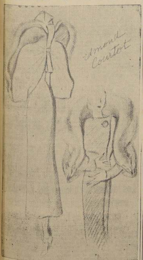
Lindo abrigo de lana negro adornado de zorro