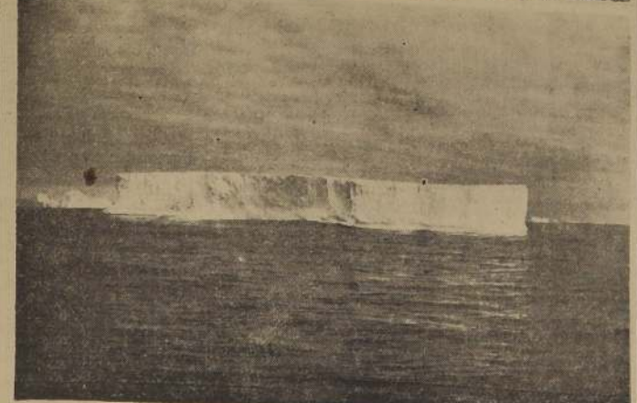
Témpano a la deriva en las aguas territoriales chilenas del Océano Glacial Antártico. Este inmenso y hermoso témpano corresponde a los denominados "tabulares". La fotografía fué tomada el año pasado

En el texto del discurso, el senador J. Prieto Concha, dijo que el Parlamento respalda la actitud del Sr. E. y que la ceremonia en Tierra de O'Higgins es una muestra de la unidad y del espíritu de la base militar. Señaló que el Sr. E. es el representante de la República y que su presencia en la ceremonia es una muestra de la unidad y del espíritu de la base militar. Señaló que el Sr. E. es el representante de la República y que su presencia en la ceremonia es una muestra de la unidad y del espíritu de la base militar.