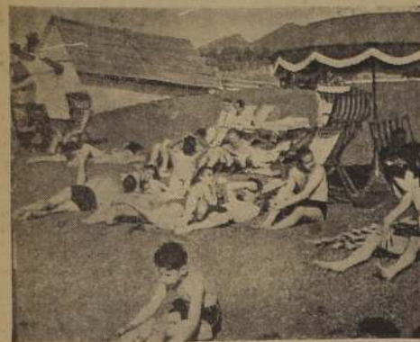
Grupo de veraneantes en las Playas del Lago Puyehue.