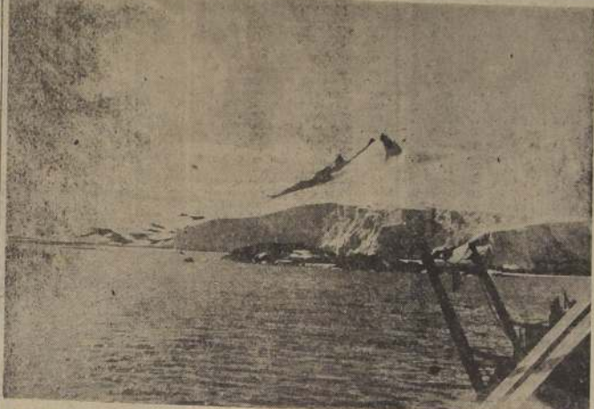
Un aspecto de la Isla Greenwich en donde se halla situada la base naval chilena de Bahía Soberanía.

Los restos fueron colocados ahora provisionalmente en la cripta de la Iglesia de San Juan Bautista, desde donde serán trasladados al Panteón familiar de los Núñez de Vela, el que ha sido restaurado por el Ministerio de Justicia.