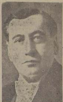
El Presidente del Senado, don Arturo Alessandri Palma, que nos formuló importantes declaraciones sobre la Antártida chilena.