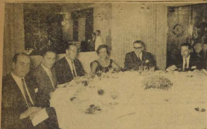
REUNION DE PUBLIC RELATIONS — Algunos Relaciones Públicos de importantes empresas se reunieron en una comida de camaradería en el Hotel Carrera. Aparecen en el gra-