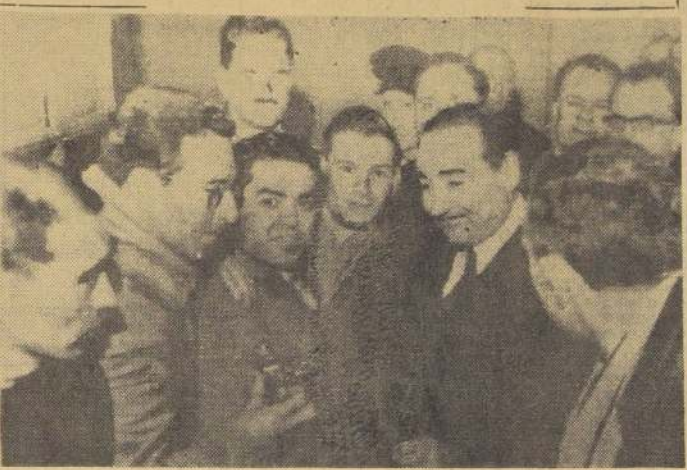
LONDRES.— El Primer Ministro turco, Adnan Menderes (segundo desde la derecha), conversa con los periodistas mientras sale de una clínica de Londres, el 23 de febrero. Fue su primera aparición en público desde que tuvo un accidente al llegar en avión a esta capital, donde debería asistir a conversaciones sobre el futuro de Chipre.