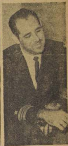
El capitán Orlando Morales, una de las figuras más representativas de la nueva tendencia que impera en la oficialidad de la Armada cubana y que ha convertido a la institución en uno de los más firmes pilares del régimen de la Revolución.