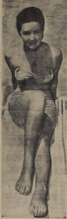
HERMOSA VERANEANTE.— HOLLYWOOD, California. La cantante italiana Anna Maria Alberghetti, disfruta de la luz solar en Hollywood, descansando de sus ensayos de canto. Está en Hollywood para intervenir en la filmación de "Las Estrellas cantando".

WASHINGTON, 27 (UP).— En su primera declaración de política exterior desde que asumió el cargo de Secretario de Estado, John Foster Dulles, dijo esta noche que los Estados Unidos no revalorizarán su política hacia Europa si Francia, Alemania e Inglaterra deciden seguir caminos separados. Los Estados Unidos han hecho una gran inversión en la seguridad de Europa, y si la Unión Europea no se logra, los Estados Unidos tendrán que volver a dar una gran inversión en la seguridad de Europa. Dulles dijo que si la Unión Europea no se logra, los Estados Unidos tendrán que volver a dar una gran inversión en la seguridad de Europa. Dulles dijo que si la Unión Europea no se logra, los Estados Unidos tendrán que volver a dar una gran inversión en la seguridad de Europa.