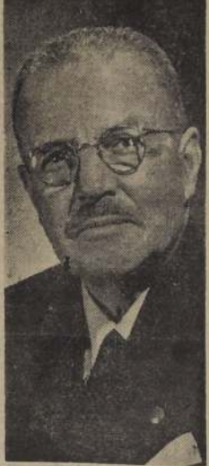
Don CARLOS IBAÑEZ DEL CAMPO

Las observaciones del Presidente de la República, en el proyecto de facultades especiales, que el Banco Central, eliminando aquella disposición que debía actuarse en tal sentido, de acuerdo con Rossetti