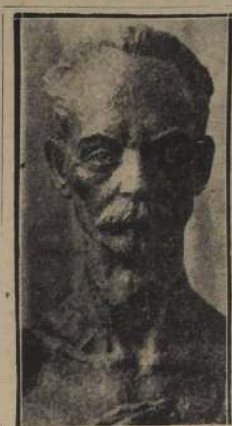
JOSE MARTI, prócer de la Independencia de Cuba, a quien se le rinde homenaje hoy, a su ilustre memoria

Hoy en la capital se realizan tres actos recordatorios de trascendente importancia. A las 10 horas, las Naciones Americanas rendirán un homenaje, junto al monumento del prócer ubicado en la Gran Avenida, paradero 5, organizado por la Sociedad Bolivariana, al que