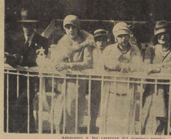
Asistentes a las carreras del domingo pasado.

DE VIÑA DEL MAR. — EN LA PERGOLA DEL CLUB DE VINA. Una concurrencia tan numerosa como distinguida asistió al día de antea a las reuniones sociales efectuadas tanto en la mañana como en la tarde, en la pérgola del Club de Viña del Mar, que, como de costumbre, obtuvieron un éxito completo.