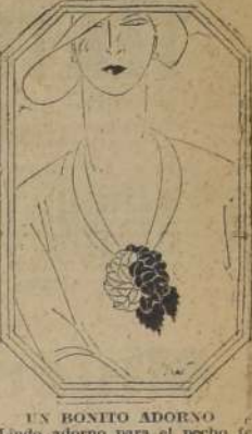
UN BONITO ADORE. Lindo adorno para el pecho femenino. Flor confeccionada en terciopelo, blanco y negro por mitades, que cierra elegantemente el escote del vestido.

"Hispano Suiza". Las damas sevilla ras le regalaron un bolso de oro, bellísimo trabajo de orfebrería. La nobles española le ofreció una pulsera hecha en Madrid. Se anuncian otros muchos regalos.