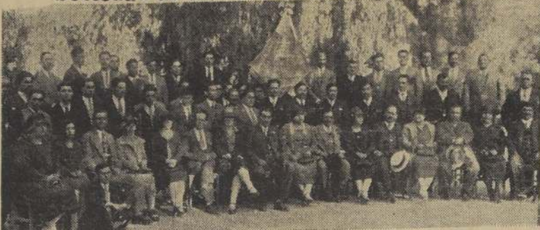
Asistentes al banquete con que esta Sociedad celebró su 10.º aniversario