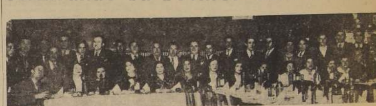
Asistentes a la manifestación con que el Club Deportivo Germania acaba de celebrar, en Puente 765, el primer aniversario de su fundación