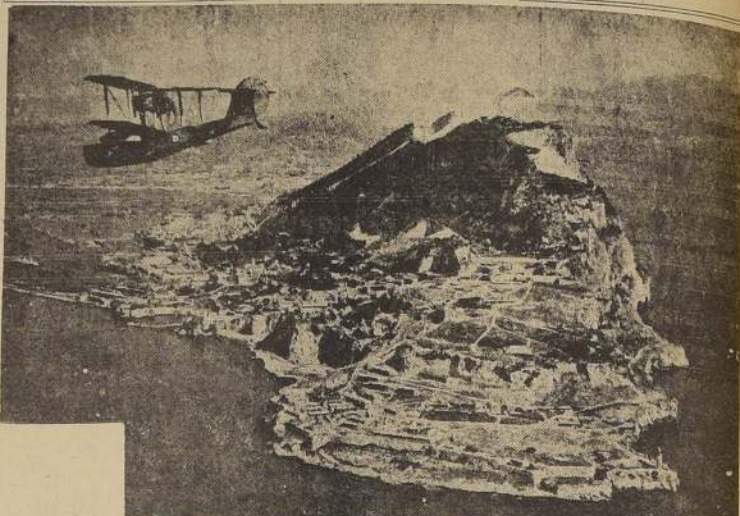
Vista aérea tomada durante un vuelo reciente de un hidroavión de reconocimiento de la marina británica sobre el peñón de Gibraltar, “llave” que Gran Bretaña posee del Mar Mediterráneo.