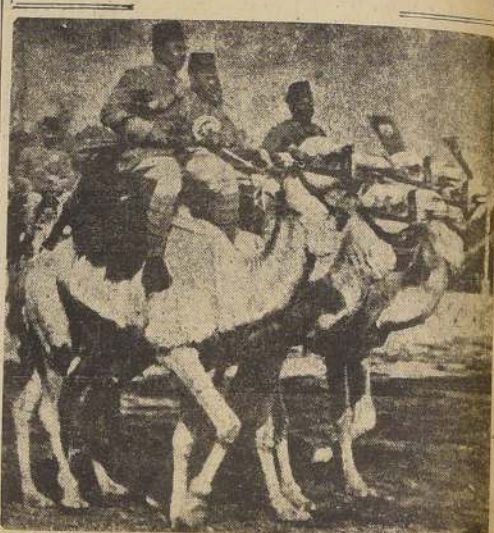
Tropas de policía egipcia, montada sobre camellos, durante un desfile realizado con motivo de las maniobras que las fuerzas británicas efectuaron recientemente cerca de El Cairo.

hasta Sainte-Anne d'Auray si lograban salvarse.