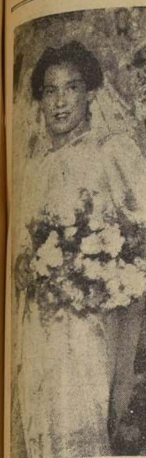
Señora Olga Calderón de Cortés