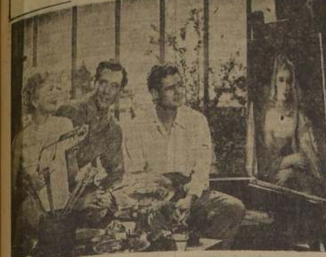
Joan Fontaine, Mel Ferrer y Robert Ryan en una escena de "Lecho de Rosas", que entra a su segunda semana de exhibición en el Central. Es un film RKO Radio.

El éxito alcanzado en su primera semana de exhibición por el film "Lecho de Rosas", que la RKO Radio Pictures, y que ha venido presentando el Teatro Central, ha hecho mantener esta cinta por una nueva semana de exhibición. Se trata de un estreno que ha sido elogiado por la crítica.