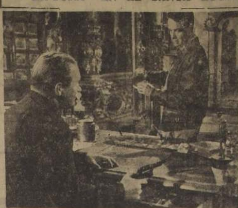
Escenas de dramatismo y emoción tiene el film RKO Radio Pictures, "La Captura".

Ayer se efectuó el estreno en el Teatro Santa Lucía del film "La captura", de la R. K. O. Radio Pictures, que ha sido recibida con agrado por el público.