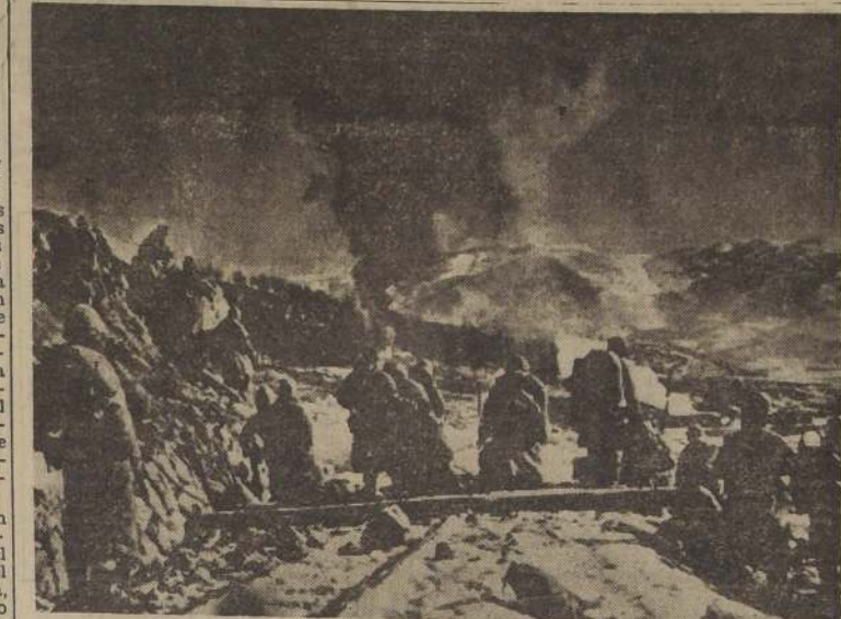
OFENSIVA AEREA EN COREA.— Bombarderos Marine Corsair, lanzan sus bombas en preparación del avance de la infantería de marina de las Naciones Unidas.

PLANTA DE SULFuros Al bajar del avión en Antofagasta, sostuvo una breve (A la página 2, columna 4)