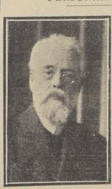
Don Federico Puga Borne

En la madrugada de hoy dejó de existir en esta capital el doctor don Federico Puga Borne, conocido hombre de ciencias, personalidad de gran prestigio en los círculos políticos del país y estrechamente vinculado a nuestra sociedad.