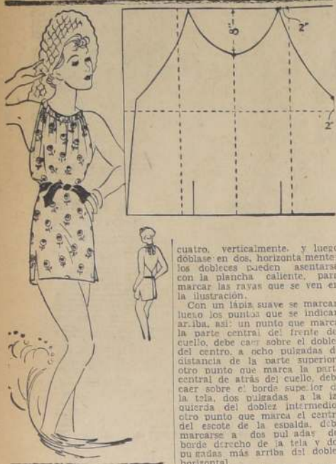
UN TRAJE DE BASO COMO-DO Y ORIGINAL

Si a usted no le queda bien la ropa de baño estrecha y horrida al cuerpo, si tiene predilección por líneas sueltas y más suaves que las de los trajes de baño comunes, le ofrecemos aquí un nuevo modelo de playa que indudablemente le gustará. Este modelo, hecho de tela sin pliegues, es muy sencillo y cómodo. He aquí cómo se corta. Corte una pieza de tela que sea dos pulgadas más ancha que la dimensión de su cintura y que sea dos pulgadas más larga que la longitud que hay entre la base del cuello y la parte de la pierna hasta donde usted desee que llegue el traje. Doblése el modelo de tela en