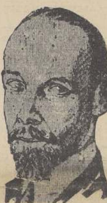
Sir Hubert Wilkins

PARA, 12. — (U. P.). — El explorador Hubert Wilkins, arribó a esta ciudad en un avión de la Panagra, en viaje a Río de Janeiro y Buenos Aires.