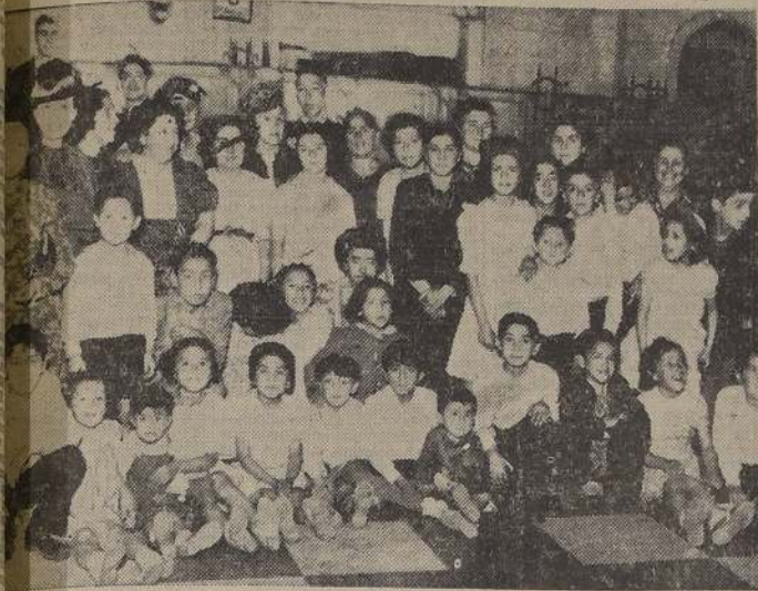
Familias obreras de Magallanes, que visitaron ayer "LA NACION"

La tarde de ayer recibimos en el grupo de familias obreras de Magallanes, que visitaron ayer "LA NACION" a iniciativa del Excmo. señor Aguirre Cerda, a la delegación que ha venido a esta capital a iniciativa del Excmo. señor Aguirre Cerda, a la delegación que ha venido a esta capital a iniciativa del Excmo. señor Aguirre Cerda.